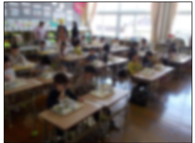
1年生初めての給食♪