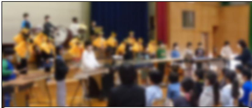
ツバメ 国府バージョン(3・4年生)： ヤクルト工場・大前田商店・土佐打ち刃物センターで学んだことを力いっぱい発表した後、素敵な演奏をしてくれました。