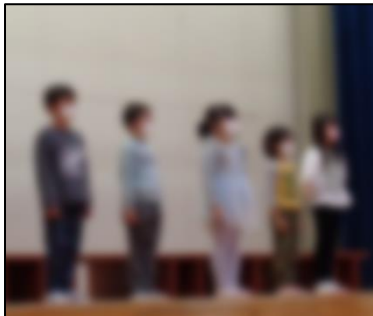
はじめのことば(1年生)： 代表者5名が大きな声で、はじめの言葉を言ってくれました。

会場にお越しくださった皆様、大きな励みや温かい拍手を本当にありがとうございました。また、学習発表会終了後、5年生による「伝統米の販売」にもご協力いただきました保護者・地域の皆様にも心から感謝申し上げます。