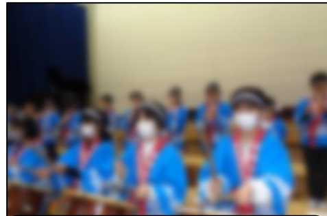
まほろば囃子(4・5年生)： 練習の成果を遺憾なく発揮した迫力のあるお囃子！