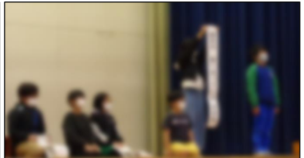
特選俳句作品発表： 6名の特選俳句児童が、俳句とそれを作った理由をしっかりと発表しました。