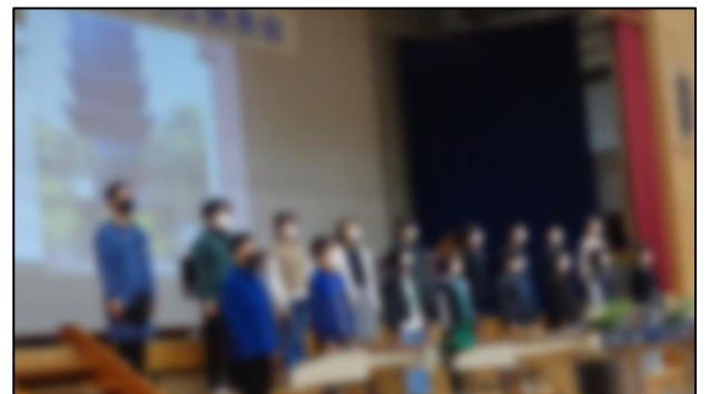
国府クエスト(6年生)： 修学旅行で学んだことを中心に発表した後、素晴らしい合奏を演奏しました。