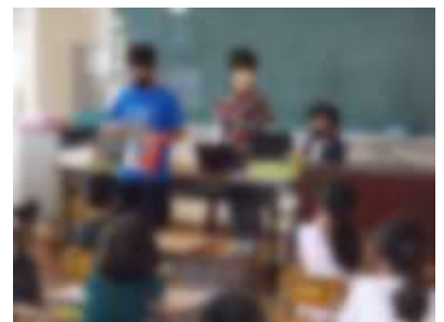
1年生に読み聞かせをしています。

本番では、6年生の巧みな読み聞かせに、どの学年も聞き入っていました。6年生、ありがとう。