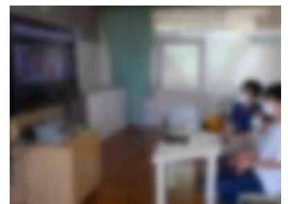
なかよし1が奈路小特別支援学級と交流