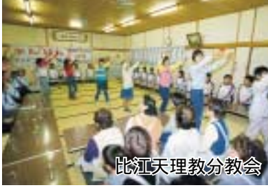
比江天理教分教会

市民の皆様、あけましておめでとございます。スポーツマンのさわやかな笑顔と、さまざまな感動でいっぱい、「よさこい高知国体」が大成の内に開催されました。皆様には、地区協力会の立ち上げから熱心な取り組み、ご苦労さまでした。 選手の受け入れ、食事の提供、そして応援、送別会に至る節々で、飾らないまごころが本当に気持ち良く感じられたとの感謝の声が、帰郷した選手・監督から、たくさん届けられました。大変うれしく思っています。「やってよかった」と実感できた国体でした。 これを機会に、文化・スポーツ活動を生涯の生きがいにし、「連携と発展」に努めて参りたいと考えています。 「市民手づくりの国体」の大成を共に喜び申し上げます。