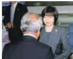
10月28日 清子内親王殿下