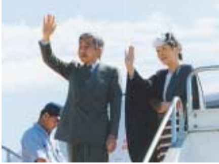
10月25日 天皇陛下・皇后陛下