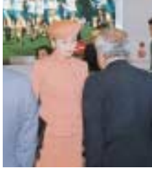
10月27日 寛仁親王妃信子殿下