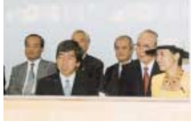
9月22日 高円宮殿下・高円宮妃殿下