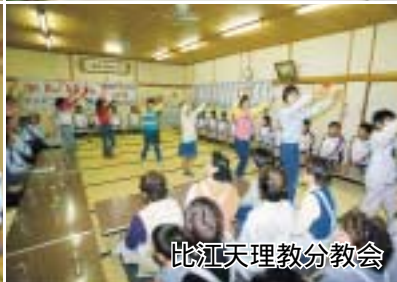
比江天理教分教会

市民の皆様、あけましておめでとございます。スポーツマンのさわやかな笑顔と、さまざまな感動でいっぱいなの「よさこい高知国体」が成功の内に開催されました。皆様には、地区協力会の立ち上げから熱心な取り組み、ご苦労さまでした。 選手の受け入れ、食事の提供、そして応援、送別会に至る節々で、飾らないまごころが本当に気持ち良く感じられたとの感謝の声が、帰郷した選手・監督から、たくさん届けられました。大変うれしく思っています。「やってよかった」と実感できた国体でした。 これを機会に、文化・スポーツ活動を生涯の生きがいにし、「連携と発展」に努めて参りたいと考えています。 「市民手づくりの国体」の大成を共に喜び申し上げます。