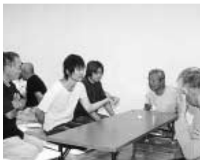
7 / 10 稲生地区第7回はし拳大会 (稲生ふれあい館)