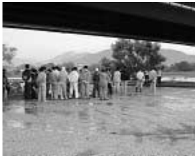
7 / 10 物部川一斉清掃 (物部川河川敷)