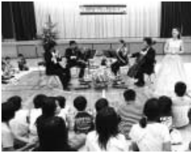
7 / 4 まほろばクラシックコンサート (国府小)