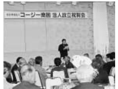
6 / 11 「知的障害者通所授産施設なんこく」が「コージー南国」に名称を変更しました。 (グレース浜すし)