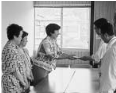
6 / 21 有害図書追放の白いポスト設置のためと国際ソロプチミスト南国が寄付(10万円)をしました。 (市役所)