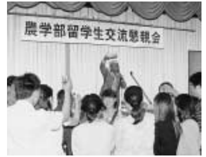
6 / 9 高知大学農学部留学生交流懇親会 (兼山庄)