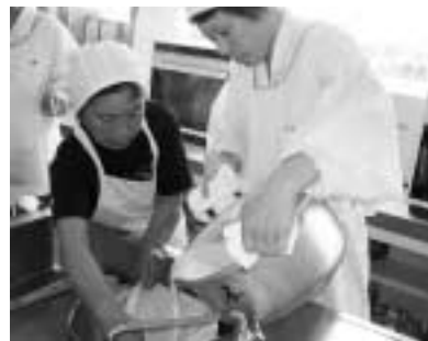
6 / 29 農業高校の生徒が農漁村女性グループから豆腐作りを教わりました。 (高知農業高校)