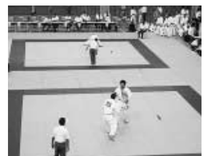
6 / 18、19 四国高等学校柔道選手権大会 (スポーツセンター)