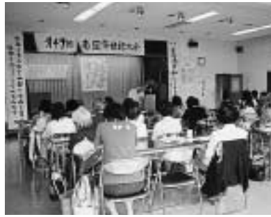
6 / 19 南国市母親大会 (大篠公民館)