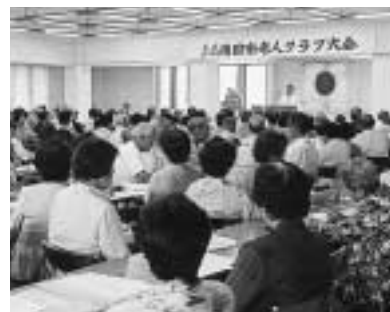
6 / 30 南国市老人クラブ大会 (社会福祉センター)