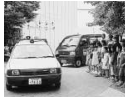
6 / 10 育成センター青色回転灯車出発式 (日草小)