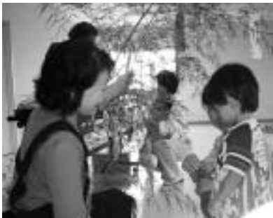
7 / 5 母子保健推進員さんを中心とした七夕の会が開かれました。 (保健福祉センター)