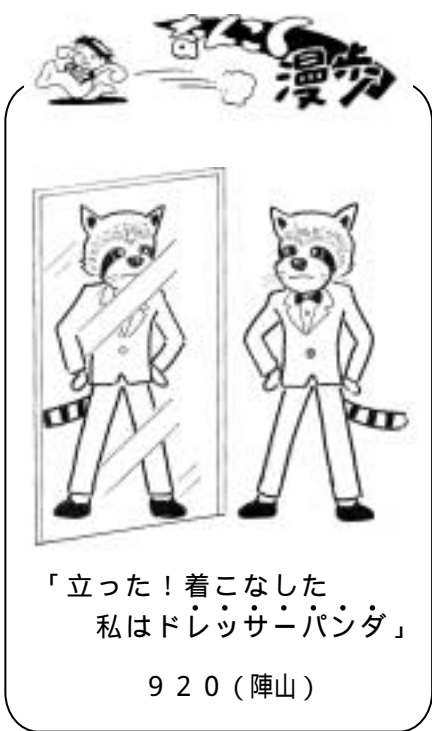
「立った! 着こなした 私はドレッシングパンダ」 920(陣山)

参加料/無料 定員/20名 共催/高知県・こうち男女共同参画センター「ソール」 備考/無料託児(要事前申込)があります。先着順です。お早めにお申し込み下さい。 申込先・お問い合わせは 財団法人21世紀職業財団高知事務所 (780・0834 高知市堺町2・26・6F 823・2667)まで