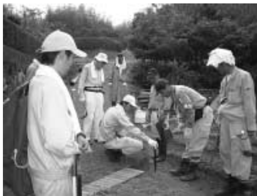
領石での調査の様子

市では初めての地籍事業による一筆地調査が、領石地区において10月下旬までの予定で行われています。