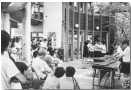
4周年記念感謝祭の様子