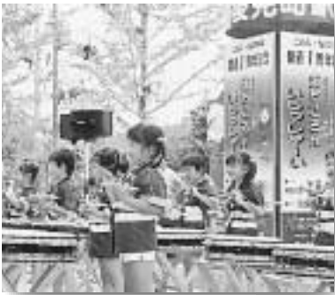
1周年記念イベントの様子