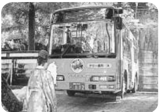
安全祈願を受ける「やまもも号」

土佐電ドリームサービスから植田線、久枝線にノンステップバスが導入され、11月7日に高知市の潮海天満宮で安全祈願祭が行われました。