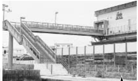
歩道橋・北口通路