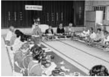
4 / 25 三和地区ふれあい弁当10周年記念会 (三和地区公民館)