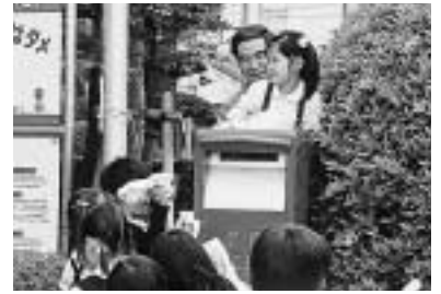
4 / 23 フレンド幼稚園児が郵便局員とポストの清掃を行いました。 (市役所)