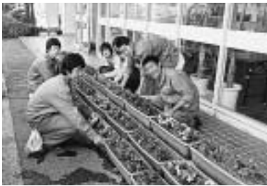
5 / 9 市役所正面玄関をきれいな花で飾ろうと、高知農業高校園芸科2年生がペゴニアのプランターを設置しました。 (市役所)