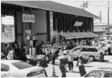
5 / 3 第9回ゴールデンウィークウエルカムサービス (道の駅南国風良里)