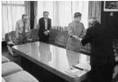
5 / 7 新任民生児童委員委嘱状交付式 (市役所)