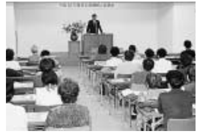
4 / 21 平成15年度更正保護婦人会総会 (市役所)