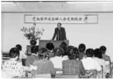
4 / 28 南国市連合婦人会定期総会 (市役所)