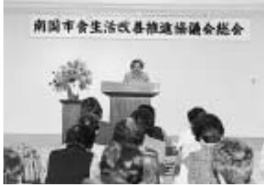
4 / 23 南国市食生活改善推進協議会総会 (保健福祉センター)