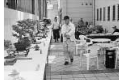
4 / 18~20 高知盆友会春季盆栽展 (サンシャイン南国)