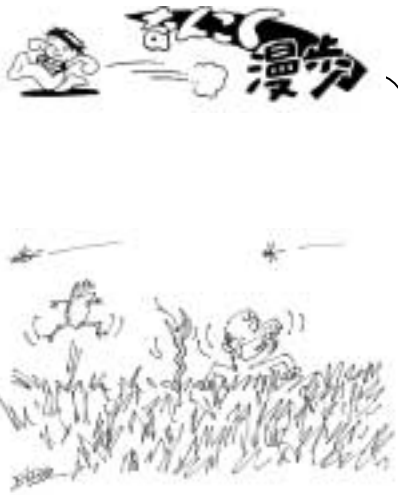
春、こんな男も いるんだらうな 古谷 栄幸(植田)