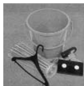
▲容器包装以外のプラスチックの例

カ ッターの刃とかカミソリの刃とかは、どう分別したらよいでしょうか？ カッターの刃などは「雑ごみ」です。刃の部分などを紙などで包み、危険の無いよう出して出してください。