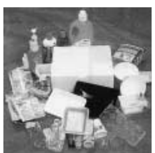
▲プラスチック容器包装類

プ ラスチック容器包装類の分別収集はいつから始まりますか？ 4月1日から月2回の分別収集を始めます。プラスチック容器包装類は、「プラ」の識別表示がついているものや、中身を消費したり、商品を分離した場合に不要になったもので