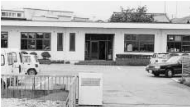
市町村合併検討会事務所（土佐山田町）