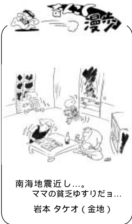
南海地震近し... ママの貧乏ゆすりだヨ... 岩本 タケオ(金地)

お問い合わせは アトスペース「さわと」 (南国市八京977 862・1250)まで