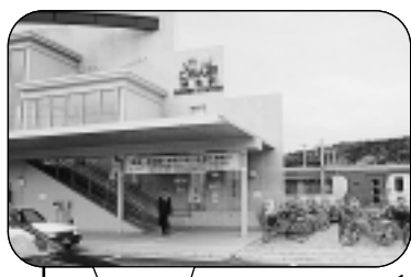
後免駅とイメージキャラクター 「ごめんえきお君」

車などでは普段味わえない 景色を楽しみながら、通勤や 通学、旅行など身近な乗り物 として「ごめん・なはり線」 をご利用ください。