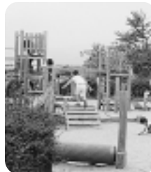
ちびっ子広場 多目的広場