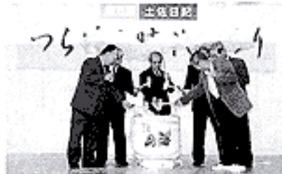
▲11/1 オープニングセレモニー （市商工会駐車場）

市民からのお便り 高知県の玄関でもある空港は、とても美しいと思います。室内の掃除も良くてきてほんとうにすばらしい空港をつくってほしいと思います。