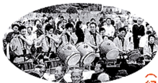
門出のまつり（紀貫之邸跡）