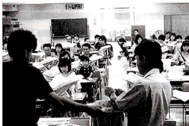
▲ベビーシート貸出し風景

9か月未満の乳児のいる保 護者を対象に貸出しを実施し ていますが、8月末現在の貸 出数は63台となっています。