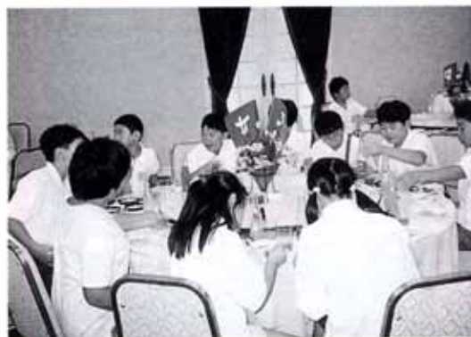
▲歓迎交流会(ホリデイ・イン高知)

8月4日(金)～6日(日)まで岩沼市の少年剣道、柔道スポーツ交流団の一行60名(選手37名、指導者・保護者23名)が南国市を訪問し、交流試合やホームステイなどの交流を行いました。 8月4日は、午前11時50分に仙台空港を出発し、大阪経由で午後3時25分に高知空港到着、半数以上の子どもたちにとって飛行機に乗ることは初体験でした。その夜は、南国市の選手や指導者も交え140名が参加し、ホリデイ・イン高知で盛大な歓迎交流会が行われました。交流会では、岩沼市の選手は「岩沼音頭」南国市は「よさこい鳴子踊り」を披露する場面もありました。