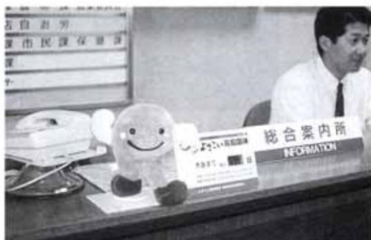
▲総合案内にくろしおくん残日板設置