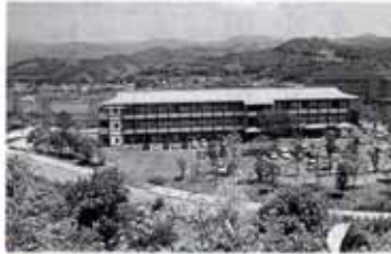
▲南国オフィスパークセンター