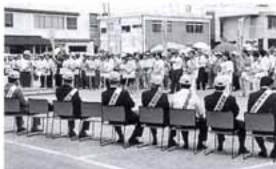
▼6/24 「ダメ。ゼッタイ。」 6・26街頭キャンペーン (市役所周辺)