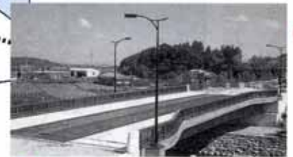
▲地名にちなんだ蛸が丘橋 人にやさしく、木をふんだんに取り入れています。

オフィスパーク開発状況 開発面積/19.40ha 分譲面積/11.65ha 19区画 センター/0.55ha 公共用地/7.20ha