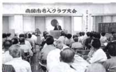
▲6/28 南国市老人クラブ大会 (保健福祉センター)