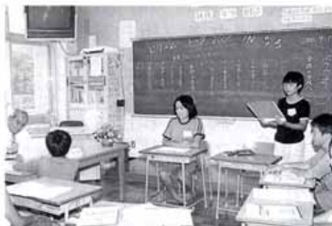
▲7/17 ドリーム・トーク市長と小学生の交流会 (奈路小学校)