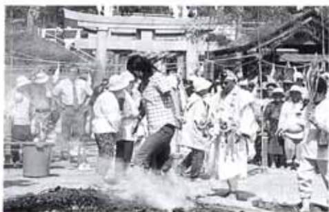
▲7/6 大護摩祈願祭 (石土神社)

道路が狭く危ないとお便りがありました。私も同感です。0歳の子どもと散歩に行きたいと思いつつ、歩道を整備してくれたいです。スーパーにも車で行かなければいけません。もう少し、歩道を整備してくれたいです。