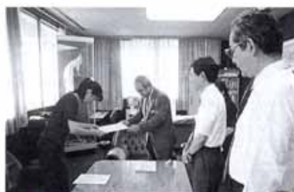
▲7/11 民生・児童委員委嘱式 (市役所)