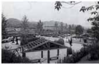
▲親水公園 領石川のせせらぎが聞こえます。