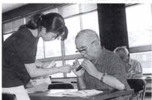
▼6/22 オカリナ教室 (大篠公民館)