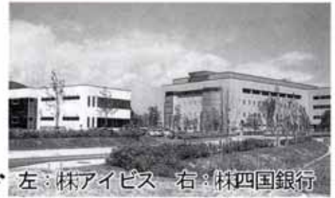
左：株アイビス 右：株四国銀行