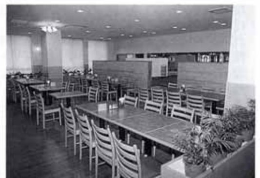
▲1階にあるレストラン(71席)会議などにも活用できます。

事業展開をしている協会員も、事をする小規模な事業所のよう、一部屋が一会社であり、会社の名札を見て何をしている会社かすぐには判断できません。設計・デザイン・会計・その他あらゆる職種があります。自由出勤の会社や、工科大学生の会社もありました。机一つで全国的な