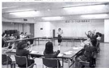
▼7/1 第3回南国いきいき女性塾開講式 (市役所)