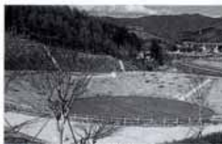
▲多目的調整池 晴れた日はテニスもできます。