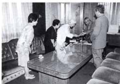
▲6/28 国際ソロプチミスト南国から社会福祉のために役立てて欲しいと社会福祉協議会に10万円寄付されました。 (市役所)