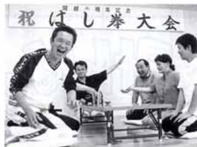
▲7/16 第2回はし拳大会 (稲生ふれあい館)