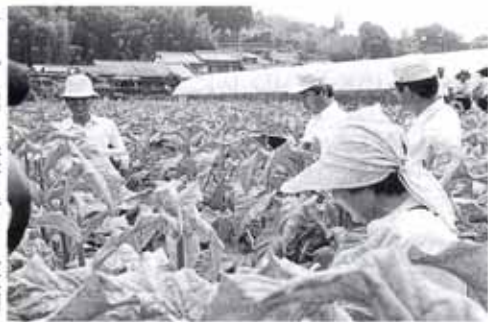
▲6/23 品評会 (久礼田たばこ乾燥場) 葉たばこ作柄