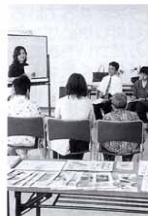
▲7/17 精神障害者家族の集い (保健福祉センター)