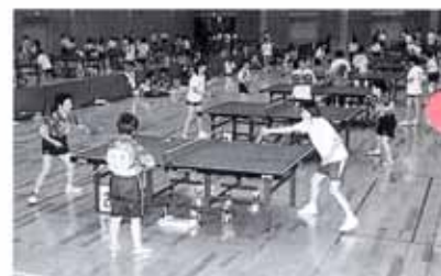
▲6/18 南国市長杯ラージボール卓球大会 (スポーツセンター)