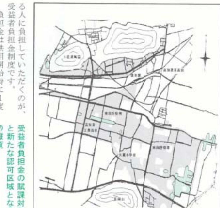
□ すでに共用開始している場所 □ 今回共用開始する場所

下水道のある生活が始まると快適な生活環境が生まれ、その土地の利用価値も増加します。しかし、この事業には多大な費用がかかります。この費用の一部を下水道の整備により直接利益を受け