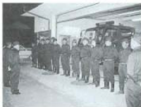
▼12/28 年末特別警戒 (市内一円)