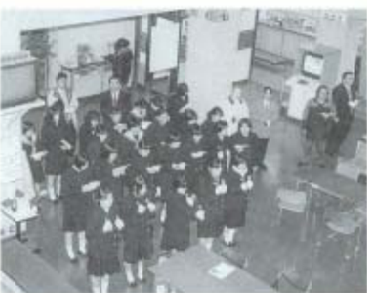
▲12/22 清和学園のハンドベル演奏 (市役所)