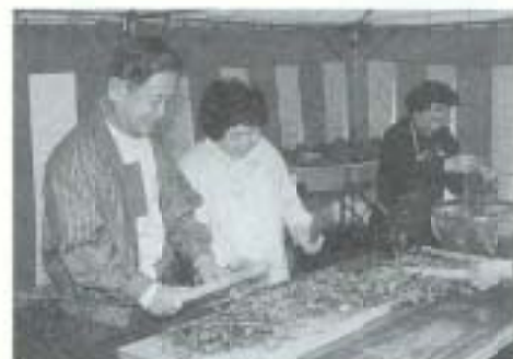
▲1/6 若菜摘み伊向会 七草がゆを堪能 (国分寺)