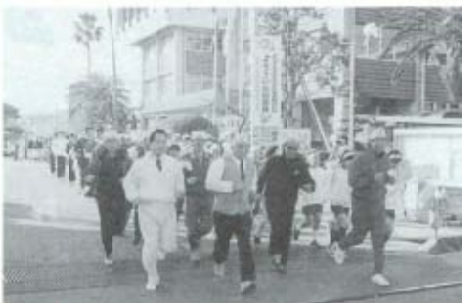
▲1/4 体育始め「走り初め」 (市役所～)