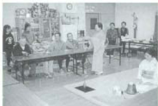
▲1/12 新年お茶会 (保健福祉センター) リハビリ教室