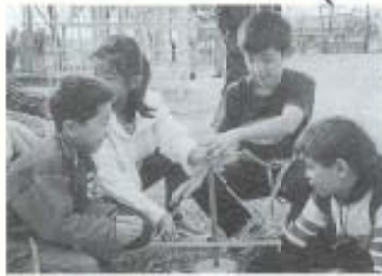
▲後免野田小学校 フェスティバル