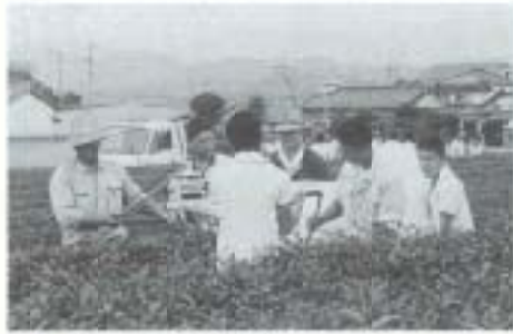
▲鳶ヶ池中学校 茶つみ体験学習