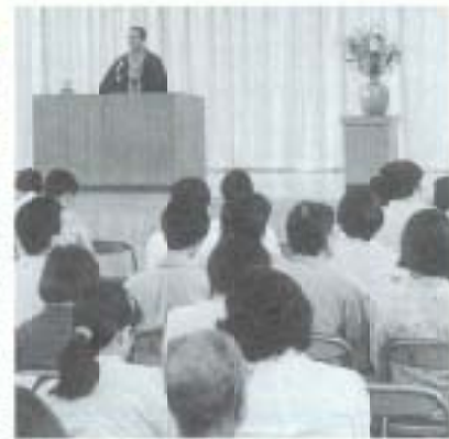
▲鳶ヶ池中学校区ブロック同研 3校PTA研修

これからの子どもたちには、地域社会での豊かな体験や自然とのかかわりを通して、自分らしさを発揮しながら主体的に生きていく力をつけていかなければなりません。そのためには、小・中学校が連携しながら取り組みを進めていくことはもちろん、学校と保護者・地域とがひとつのネットワークとしてつながり、「学びの共同体」をつくり上げていくことが大切だと考えています。私たちは、「開かれた学校」づくりを目指す中で、鳶ヶ池中学校・後免野田小学校・長岡小学校に通う子どもたちが、ともにつながり豊かに成長してくれることを願っています。 (3校研究推進委員会)