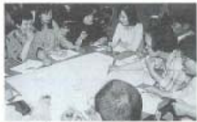
▲3校PTA 「学び」「育ち」ネットワーク