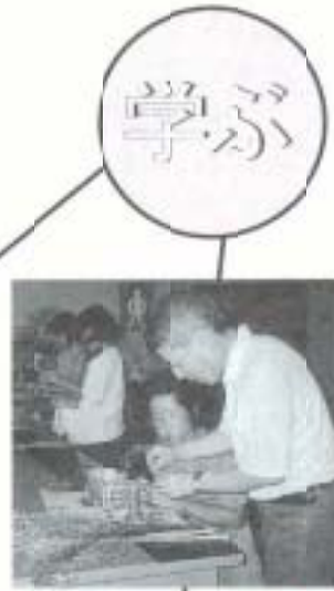
▲長岡小学校 生花クラブ