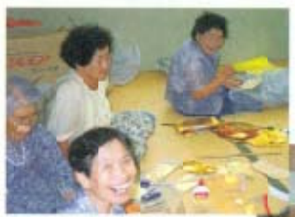
地域が一体となって準備にかかりました

11月11日、「第12回土佐日記大湊出港記念祭」が、前浜の大湊公園で行われました。紀貫之の記した土佐日記には、大湊に寄港し11日間停泊したとの記述があります。その大湊が