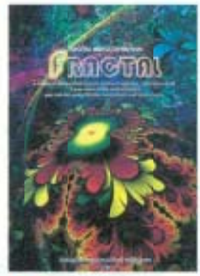
▲「フラクタル展覧会ポスター」