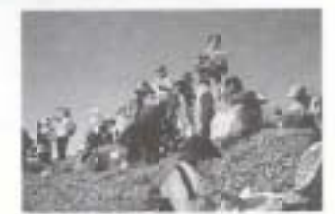
▲10/24 四季・野山の自然講座 地図の見方を学習 (小桧曾山～土佐矢筈山縦走登山)