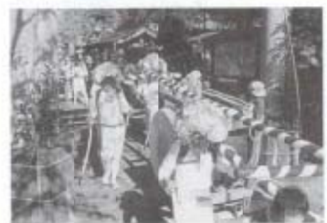
▲11/6 「開かれた学校づくり」研究発表会 (後免野田小学校) 伊都多神社太鼓 練り太鼓 (前浜)