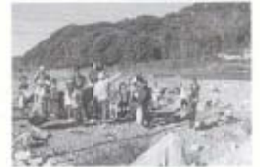
▼11/13 国分川の観察と石の採集 (国分川沿い)