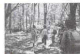
▲10/21 四季・野山の自然講座 プナの原生林を歩く (広島景比婆山)