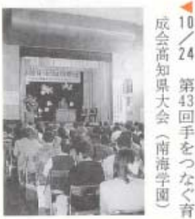
▲10/24 第43回手をつなぐ育成会高知県大会 (南海学園)