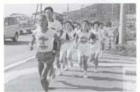
▲10/28 がんばれ難病患者 日本一周激励マラソン (清和女子高校バドミントン部員が伴走)