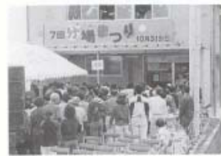
▼10/31 第7回分場まつり (香南くろしお園 分場なんこく)