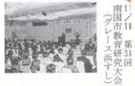
▲11/10 南国市教育研究大会 (グレース浜すし)