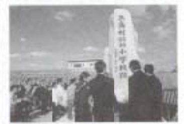
▲11/14 三島村尋常高等小学校跡記念碑除幕式 (高知空港北側)