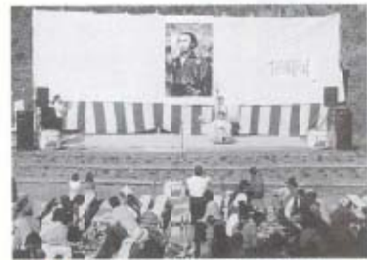
▲11/14 第7回才谷村龍馬祭 (才谷龍馬公園)