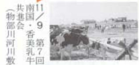
▲11/9 南国・香美乳牛共進会 (物部川河川敷)