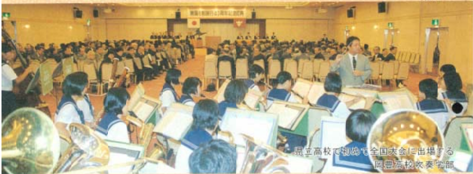
県立高校で初戦で全国大会に出場する 岡豊高校吹奏楽部