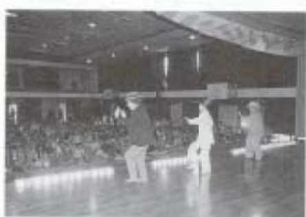
▲10/10 第19回南国市演芸大会 (市民体育館)