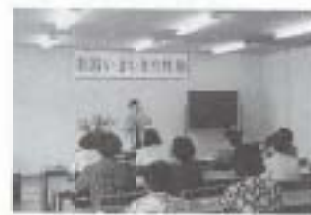
▲9/18 南国いきいき女性塾 (市役所)