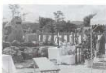
▲9/25 国府史跡保存会40周年記念碑落成式 (紀貫之邸跡)