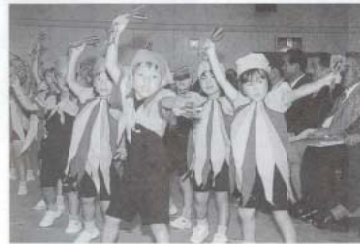
▲ひまわり幼稚園児による力強い踊り。会場から大きな拍手が送られました。