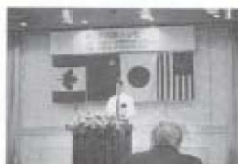
▲10/2 第2回国際メッセージ (グレース浜すし)