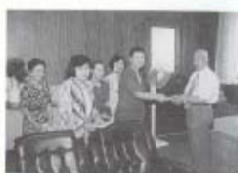
▲9/17 市連合婦人会による複十字シール募金運動 (市役所)