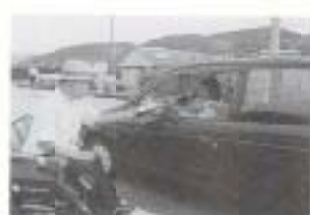
▲9/21 交通安全の呼びかけ (稲生芦ヶ谷)