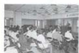
▲10/8 女性問題学習会 (社会福祉センター)