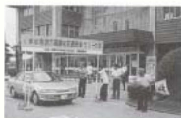
▲9/16 第2回高齢者交通安全ラリー大会 (市役所出発)