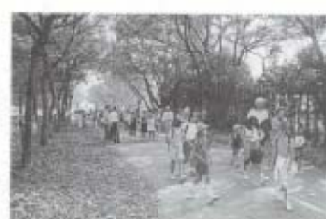
▲10/10 第11回南国市さわやか健康ウォーキング大会 (高知大学農学部出発)