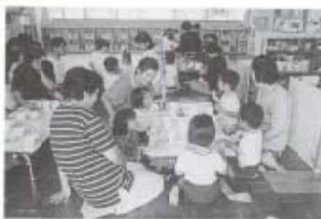
▲9/17 关消費拡大事業おにぎりまつり (長岡西部保育所)