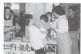
▲10/15 ミニデイトリハビリ教室合同作品展におけるクッキーなどの販売 (市役所)