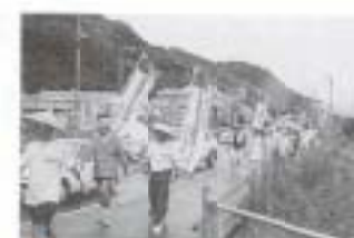
▲9/21 県東部地域規格道路建設促進の要望運動 (国道55号線沿)