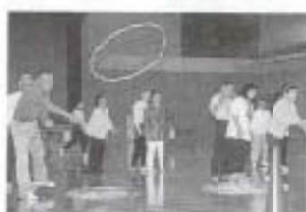
▲10/13 中央東広域身体障害者連絡協議会体育大会 (スポーツセンター)