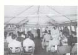
▼9/21 瓶岩幼稚園増改築起工式 (尖崎)