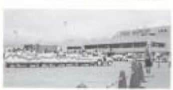
▼9/19 空の日記念事業 (高知空港)