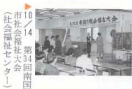
▲10/14 第34回南国市社会福祉大会 (社会福祉センター)