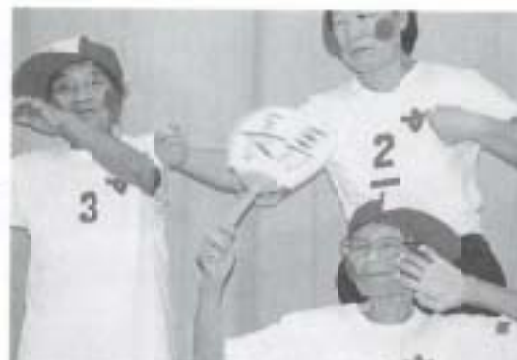
▲9/15 三和敬老会 30歳と89歳の「むかしむすめ」 (三和小体育館)