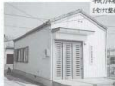
この阿戸地区集会所は平成11年度宝くじ助成事業によって整備したものです

近年の建物火災による死者のうち、約9割は住宅火災によるものであり、また高齢者層の火災における死者の発生は、若年層に比べて格段に高く、出火原因は、てんぷら油の火の消し忘れが多い傾向にあります。このため、住宅にお