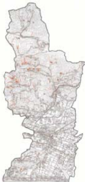
— 崩壊土砂流出危険地区 ● 山腹崩壊危険地区