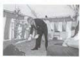
▲9/22 大湊小学校体育館起工式 (前浜)