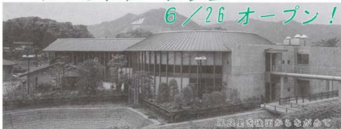
風良里を後面からながめて

農林業振興をめざす直売施設 図①の施設が農産物直売施設です。JA南国市に管理委託を行う予定で、生産者が栽培した生産物やそれらを利用した加工品などを販売します。