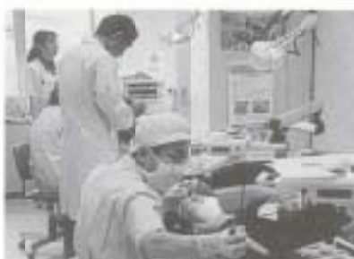
▲30・40・50歳記念 総合健康診査(歯科)