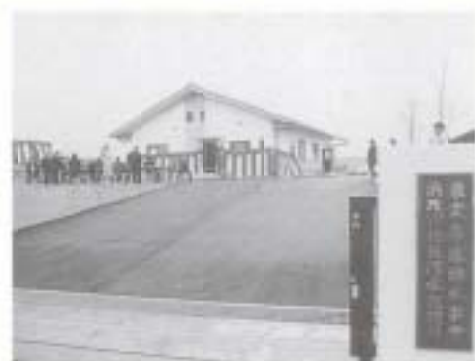
4/2 浜改田農業集落排水事業通水式 (浜改田処理場)