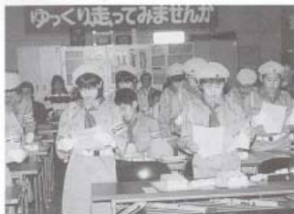
4/10 交通少年団入団式 (交通会館)