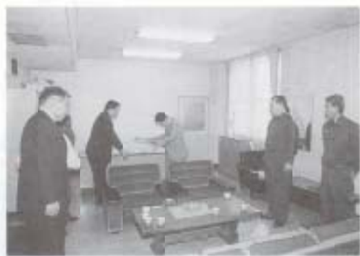
4/14 市消防本部が 高速道路における救急 防災活動に貢献したと 日本道路公団四国支社 から感謝状をいただき ました。(市消防署)