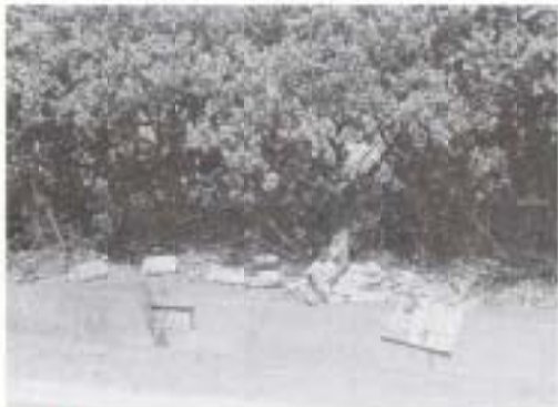
▲道路わきに散乱した空き缶や雑誌など