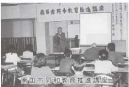
南国市同和教育推進講座

今回の講座に参加したのは、南国市からこの講座の案内がきて、総務に相談したところ、参加の承諾をもらったので、何か学ぶことができたという思いで参加しました。最初は同和教育について無知だった自分が恥ずかしく、他の参加者と一掃に勉強していけるのだろうかとか、自分とは場違いな所へ来ているのではないのかなど、いろいろな面で不安を感じていました。しかし、回を重ねるごとにだんだん楽しみになってきて、自分が気付かなくて新しい発見があったりして、次回も頑張っていこうと思うようになりました。