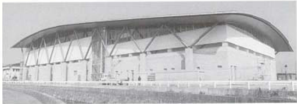
▲高知国体バドミントンの会場となる総合体育館(仮称)が完成します

市の廃棄物は、収集量が依然増加傾向で推移しています。市民の生活環境を快適に維持するため、廃棄物の排出を抑制し、リサイクルを含む適正な処理を推進します。 八京地区への最終処分場建設問題は、地元交渉を重ねて