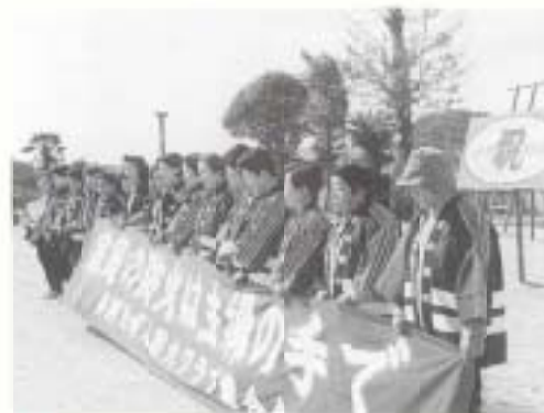
▲2/3 市婦人防火クラブ連合会の12番目の組織として、「長岡東部四季(よき)婦人防火クラブ」が結成されました。

防災行政は、昨年の集中豪雨を過去のものとせず、今後の防災対策に生かします。その具体策として、住民一人ひとりが「自らの命は自らで守る。自らの地域は皆で守る」という自主防災意識の醸成を促すために、各地域