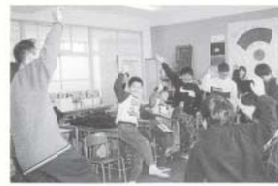
2/10 後免野田フエスティバル 学校・家庭・地域の連携を深めるため、ケン玉遊びなどの8つの遊びから学ぶ教室を開きました。 【写真II国際交流教室】 (後免野田小学校)