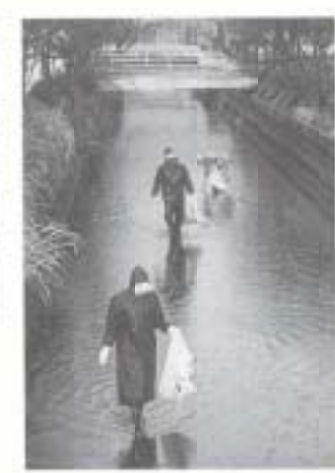
3/7 川干 舟入川・新川川・藻川の 一斉清掃(舟入川)