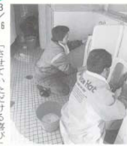
3/16 「させていたただける喜び」を確認しながら、イエローハット従業員の方々と、第3回トイレ清掃勉強会 (JR後免駅公衆トイレ)