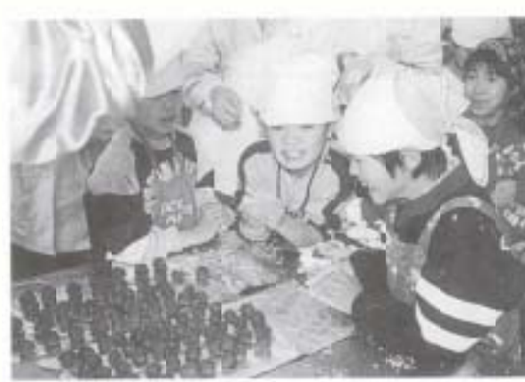
2/19 もちつき体験学習 後免野田小学校児童と 高知農業高校生の連携 (高知農業高校)