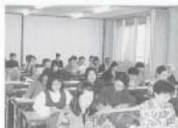
▲昨年度の「南国いきいき女性塾」

平成11年度南国いきいき女性塾 塾生募集 女性のパワーアップを目的とした人材育成講座の受講生を募集します。