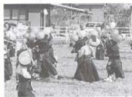
2/14 蔵福寺剣道大会 (田村天三寺蔵福寺)