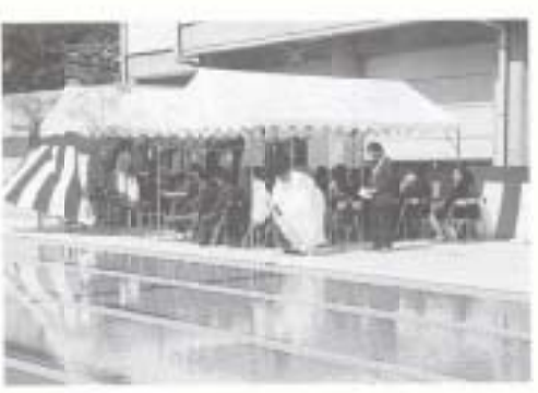
3/6 奈路小学校プール落成式 (奈路小学校)