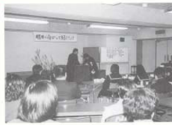
3/4 社会への旅立ちを励ます会 (市役所)