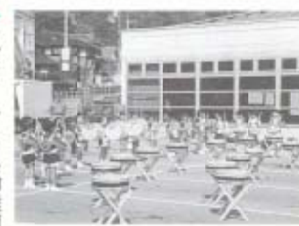
3/6 アトム幼稚園見学会 (サンブラザ新鮮館)