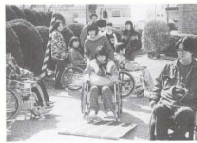
2/18 なんこくボランティアDAY (社会福祉センター)