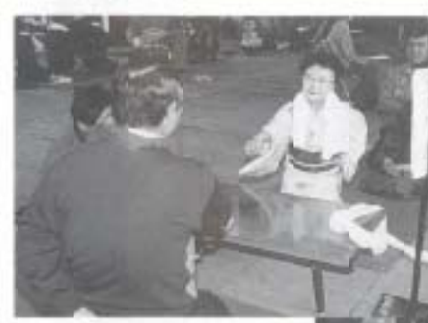
2/28 第20回 土佐はし拳全日本 選手権南国場所 (市民体育館)