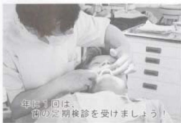
年に1回は、歯の定期検診を受けましょう！

健康文化都市「優3ゆめ1健康づくり」は、か・ん・た・んは、小学校低学年などを対象にして「命の大切さ」をテーマに、動物との触れ合いなどを取り入れた事業に取り組みます。検診事業では、新たに65歳以上を対象に県歯科医師会士長南国支部会のご協力をいただき「高齢者歯科施設検診」を実施します。