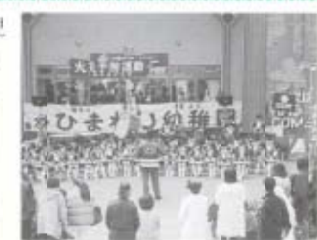
幼年消防クラブ 防火普及演奏