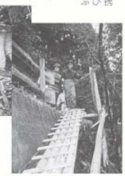
3/5 「黒滝の自然を守るボランティア」が、看板・遊歩道を設置しました (黒滝 滝ヶ淵)