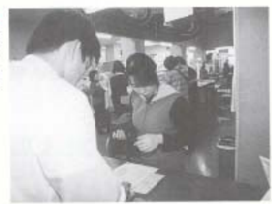
3/3 高知市との住民異域 交付連携を開始し、 高知市民が申請に訪 れました(市役所)