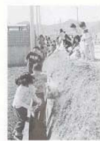
2/22 久礼田小学校 児童が学校周辺を清掃しました