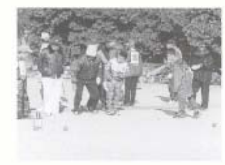
2/13 第10回南国市ゲートボール大会(霧ヶ池運動場)