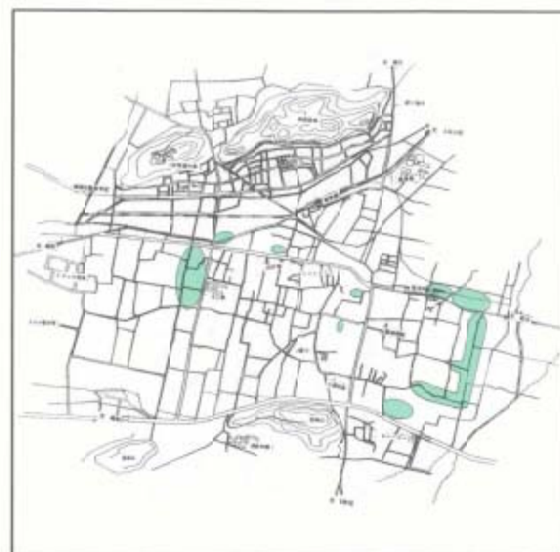
●は、下水道供用開始地域

清流の流れる美しいまちを目指してスタートした下水道は、皆さんの協力により、10年度の工事も無事完了し、4月1日からその完了部分を供用開始し、7.7haが追加となり129.5haとなります。下水道の供用開始区域に土地を持っている人には、次のふたつの義務が生じます。