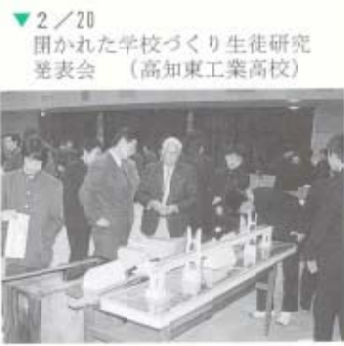
2/20 開かれた学校づくり生徒研究 発表会 (高知東工業高校)