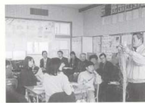
3/15 第2回米づくり親子セミナー (大湊小学校)