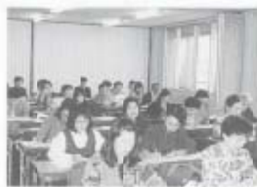
▲昨年度の「南国いきいき女性塾」

平成11年度南国いきいき女性塾 塾生募集 女性のパワーアップを目的とした人材育成講座の受講生を募集します。