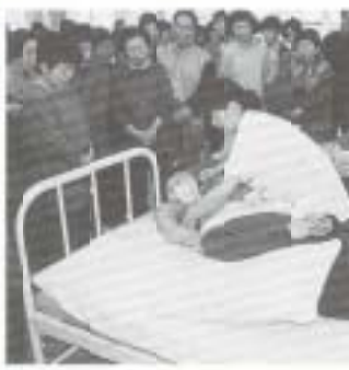
前回のボランティアDAY

なんこくボランティアDAY いつでも気軽にボランティア ボランティア体験をとおして、ボランティアの発掘育成や、活動の啓発・推進を図ることを目的に開催します。 【とき】 2月28日(日) 午前10時～午後3時 【ところ】 社会福祉センター(日吉町) 【内容】 ▼体験コーナー 介護・手話・車イス介助・国際交流・盲人ガイド・災害救援 など ▼販売コーナー 焼きそば・きし鍋・おでん・陶芸 など ※問い合わせは、市社会福祉協議会(☎4444)まで