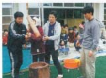
12/8 南国市消防 職員協議会と香南消 防組合が合同で恒例 のおもちつきを行い ました(希望の家)