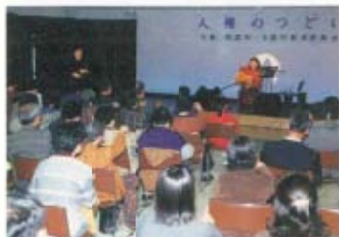
12/13 人権のつどい (保健福祉センター)