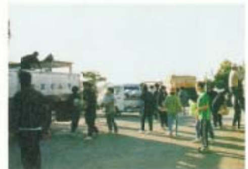
5月…年2回の廃品回収の1回目です。収益は、生徒会の活動費になります。PTA、地域の方々にもお世話になりました。