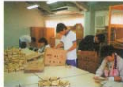
さあ、納豆つめよっと! (来員作業所でボランティア体験)