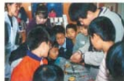
第1回 南国こども フェスティバル (大篠小学校)

11月22日、体験学習活動をおとして地域の人と交流を深めようと、第1回南国こどもフェスティバルが、大篠小学校で開催されました。市小・中学校PTA連合会の主催。会場には、おじやみづくりや竹細工などの体験コーナー、くだもの電池やシャボン玉などの学習コーナーなどのさまざまなコーナーが用意され、子どもたちの楽しそうな歓声があちこちで上がりました。