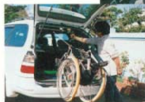
楽々荷物積み込み機

「作品の商品化はしません が、希望者には実物を見せて、 作り方のアドバイスをします ので、ご自由 にお作りくだ さい」とのこ とです。