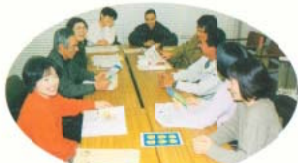
▲いつもにぎやかな広報委員会

全自動日植え刈り取り機？意外に実現しそうな夢でナネ。モミ摺りは、できるんじゃおかネー？ こうなったらオニギノも作ってもらいたいネー。 米の減反への反対というより、食料危機へのメッセージと受けとります。いつかはこんな風景みてみたい！