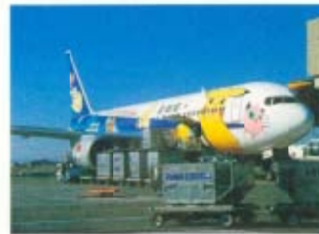
▲子どもたちに大人気！「ポケモン」飛行機