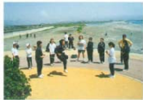
5月…1年生歓迎の遠足(トリム広場)帰りは、空き缶などのごみ拾いを全員で行いました。