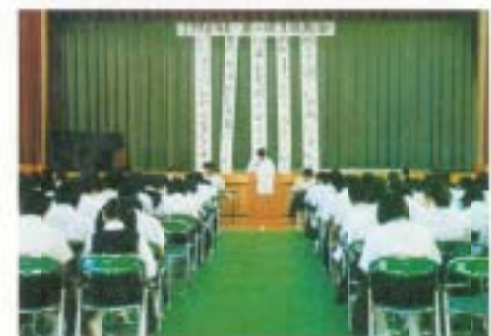
6月…生徒総会では、昨年度1年間の総括と今年度の方針を決定します。明るく楽しい学校をつくっていきます。