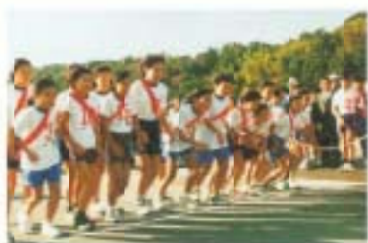
11/28 第3回南国市小学生駅伝競走大会 (なんごく流通団地 周回コース) 優勝 十市鉄人クラブA