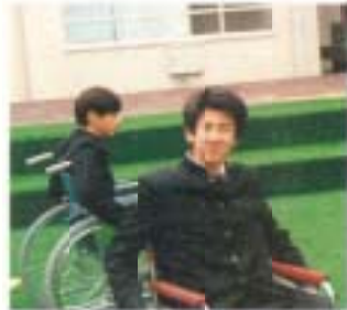
僕初めて車椅子に 乗りました。 (文化祭・体験コース)