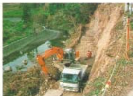
▲着々と進む緊急復旧工事

農地200か所以上 4億2千万円、 農業施設で約200か所超 8億6千万円、 農産物 4億5千万円、 合計 17億3千万円