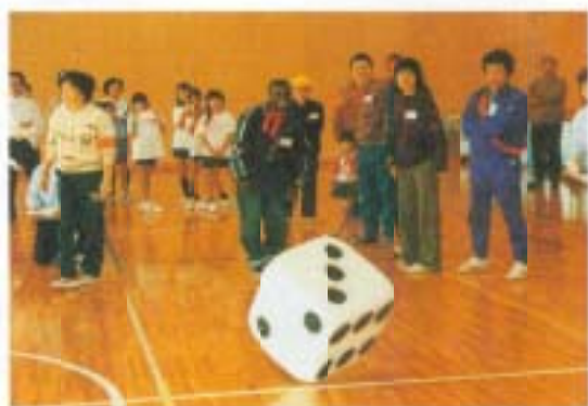
11/23 みんなで楽しむ国際交流 (南国勤労者体育センター)