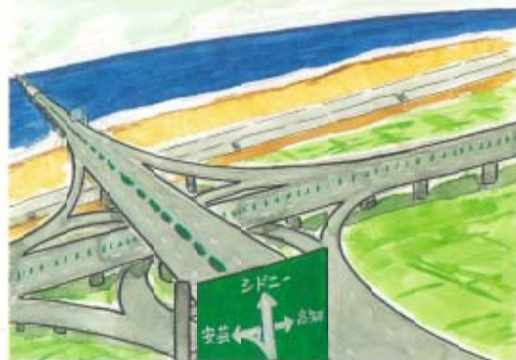
▼「四国四橋時代」 — 南国・シドニールート完成 — 920さん（陣山）