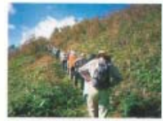
▲平成10年10月22日 大川村野地峰登山

氏名・年齢・電話番号を明記のうえ、次のところまで ※問い合わせ・申し込み先は、保健課国保「アクアエクササイズ」係(〒703-8501 南国市大桶甲2301 ☎6556)まで 「コンピュータヘルスチェック」に95人が参加、ご協力ありがとうございました。 かかやく尾根、大雪原の中を歩くスキーと、「ぞう山」の雪ロハイキングを楽しんでみませんか。 ▲とき 平成11年2月17日(休) 行き先 鳥取県奥大山「チロルの里」 対象 市内在住の男女