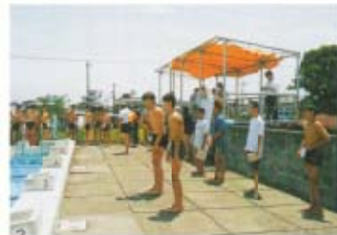
7月…水泳大会です。最後まであきらめずに頑張りました。