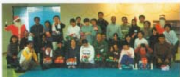
12/1 ミニ・デイケア 香南くろしお園分場「なんごく」との 合同クリスマス会 (保健福祉センター)