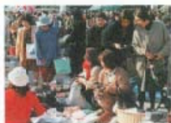
11/22 '98秋 WELCOME なんごく フリーマーケット(市役所駐車場)