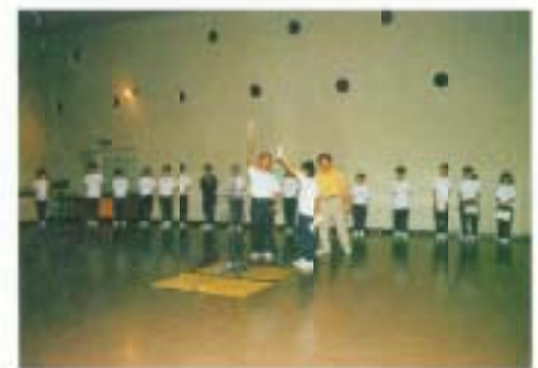
6月…1年生の集団宿泊研修です。香南中は大湊小学校と日章小学校の2校から仲間が集まります。