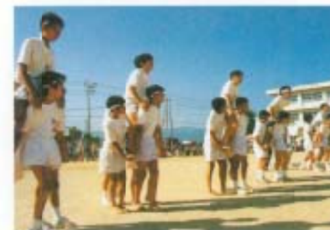
9月…体育祭、私たちの手で成功させました。(テーマ Do Your Best)