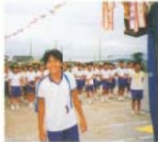
輝いているよ、僕の顔 (体育祭・閉会式)