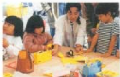
11/22 第35回南国市ほいくまつり (J.A野田ライスセンター)