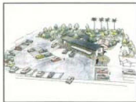
▲道の駅南国「風良里」完成イメージ図

高知市との住民票の写しの広域交付（両市役所で双方の住民票の写しを交付する事業）について、両市で協議を進めてまいりましたが協議が整いましたので、本議会に提案、