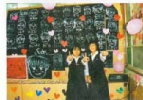
10月…文化祭、テーマ(生きる Let's Live In)の下、学級展示・合唱コンクール音楽部の発表などを行いました。多くの人が見に来て下さいました。校区のお年寄りの方にも80枚ほどのハガキを出しました。