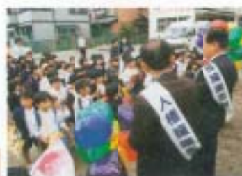
人権週間スタート 12/4 人権啓発活動 (フレンド幼稚園) 人権の花をプレゼント (夢の里)