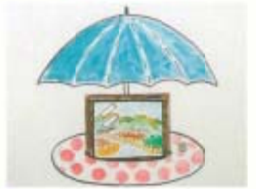
▲「県展後期展出品作品」