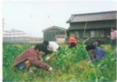
ウーン 草ぬきは楽しいな! (大豆畑の草ぬき作業)