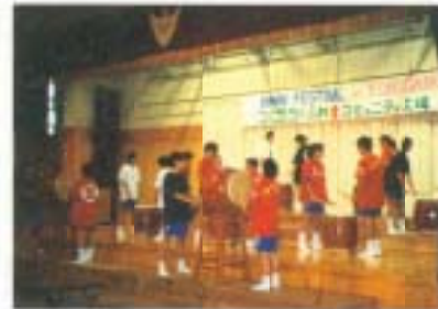
叩くぞ叩くぞ、ドンドンドン (文化祭・解放太鼓)