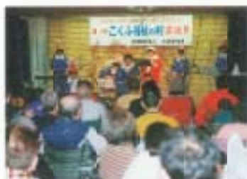
12/12 第5回なんごくふ福祉の村 文化祭 (国府寮)