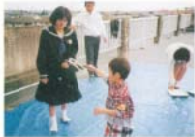
大きなシャボンできるかな? (文化祭・体験コース)