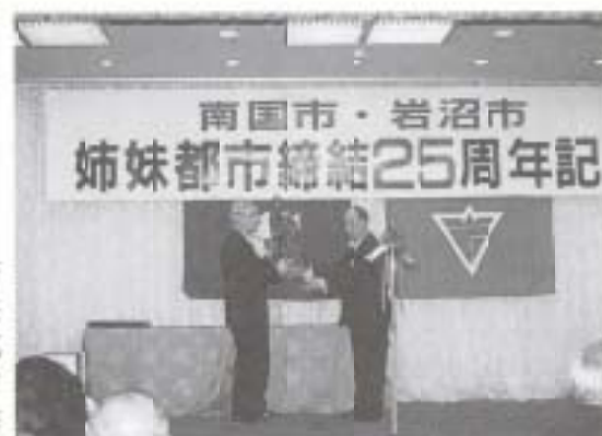
▶ 8/21~23 姉妹都市締結25周年記念市民訪問団 (宮城県岩沼市)