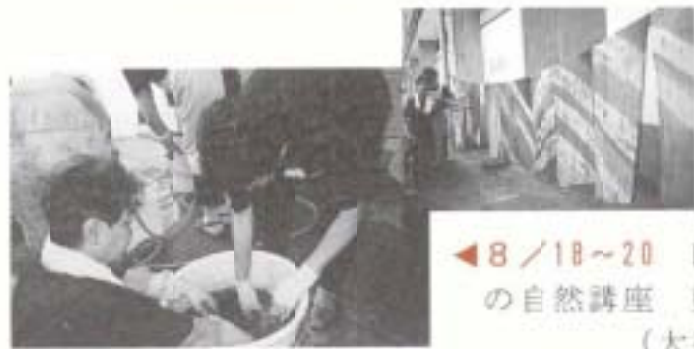
◀ 8/18~20 四季・野山の自然講座 藍染め教室 (大篠公民館)