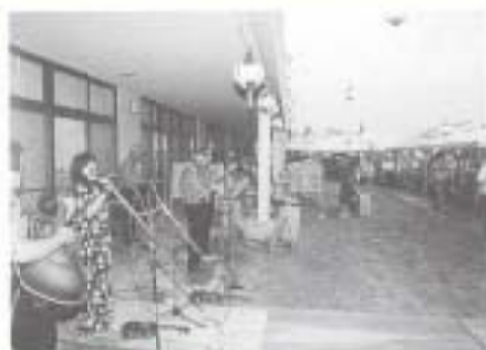
▲ 8/22 夢の里納涼祭 (夢の里)