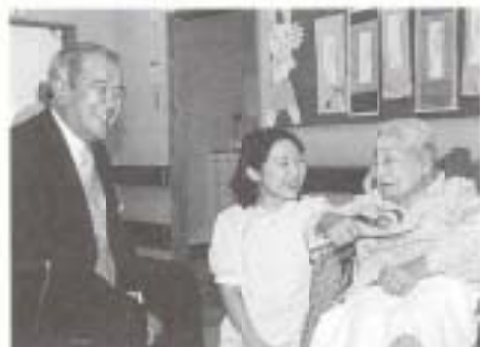
▲ 9/2 恒例の100歳訪問。ことし、市内で100歳以上が20人になりました