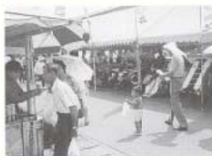
▲ 9/11 第7回県農業振興フェア (農業技術センター)