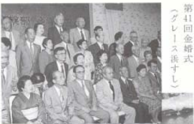
▲ 9/1 第41回金婚式 (グレース浜すし)