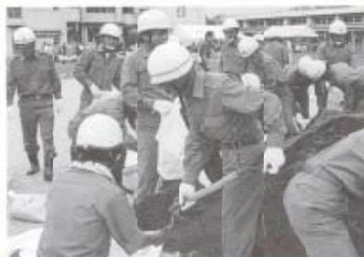
▲ 9/1 長岡地区震災訓練 (鷹ヶ池中学校グラウンド)