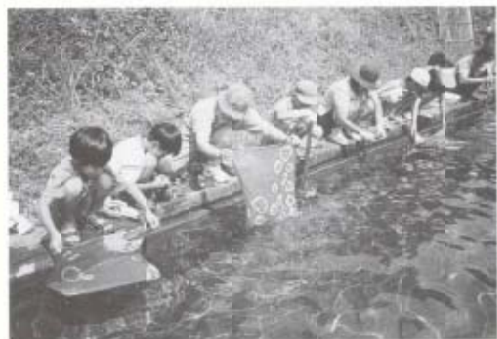
▶ 9/5 わくわく自然講座 日章小学校3年生が藍染めに挑戦 (黒滝青少年自然の家)