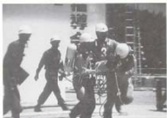
▲ 7/30 南国消防署救助隊が四国救助技術大会で入賞 (愛媛県松山市)