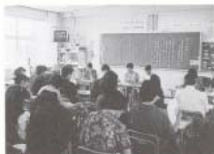
▲ 9/9 第31回南国市同和教育研究大会 (大篠小学校ほか)