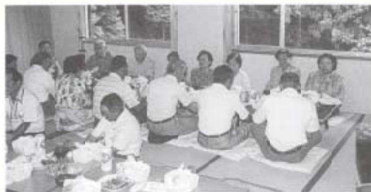
▲▶ 9/2 若衆が帰郷して敬老会 高齢者の楽しい笑い声が山あいに響きました (黒滝公民館)