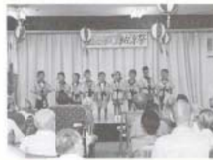
▲ 8/22 清風園納涼祭 (清風園)