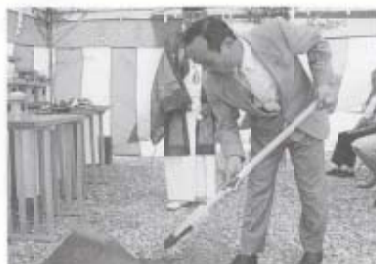
▲ 9/7 農村集落排水事業久礼田処理施設建設安全祈願祭 (久礼田)