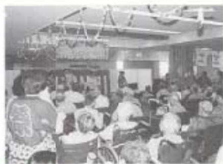
▲ 8/1 ふれあい夏祭り (ケアポート南国)