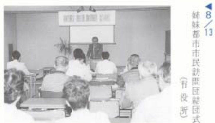
▲ 8/13 姉妹都市市民訪問団結団式 (市役所)