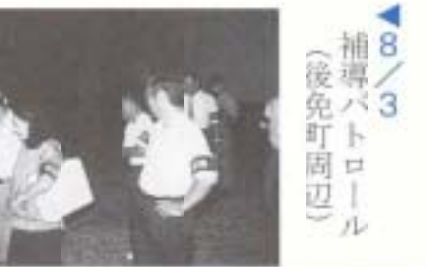
▲ 8/3 補導パトロール (後免町周辺)