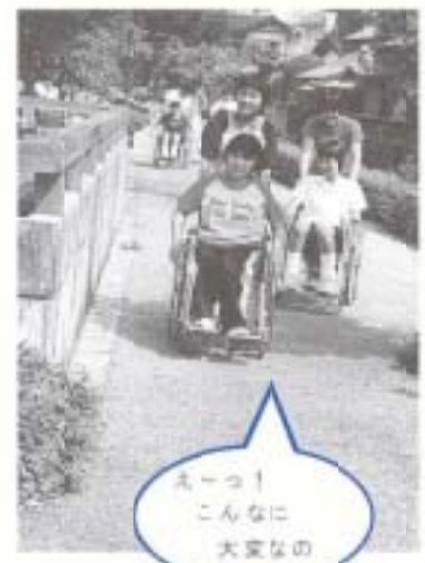
えーっ! こんなに 大変なの