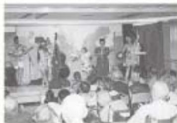
▼ 7/21 ハワイアロハダンス一行が表敬訪問 (夢の里)