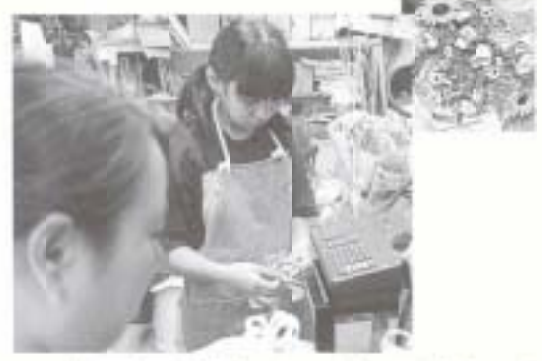
ひまわり乳業株式会社 (物部)

花の命は短くて…。とってもむづかしい仕事。でも人の気持ちを慰めてくれる花。楽しさをできるだけ長く保つ、秘密のワザをしっかりと教わりました。