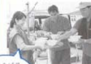
まほろば餅 まどーぞ!