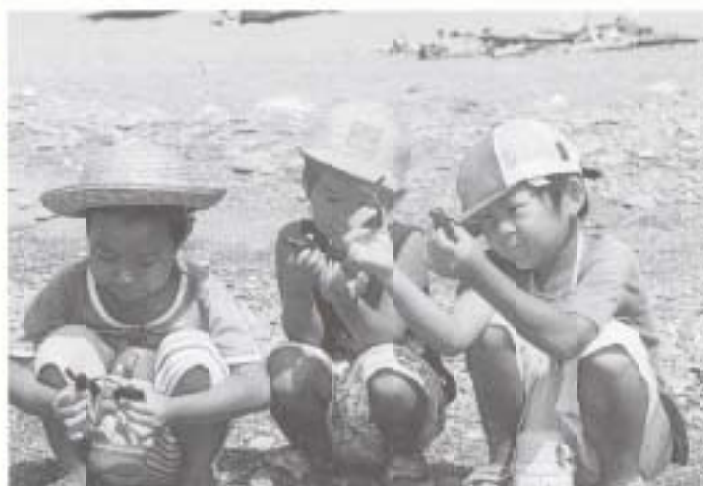
▲ 8/17 浜改田保育園と里保育所の園児による海亀の放流 (翠平山前の沙浜)