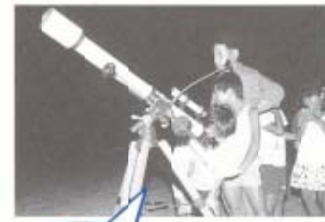
フラッシュが とぶしいよー!

恒例になった市商工会主催の小学生の企業訪問(写真11右上)。ことしも市内外の企業などを見学しました。 暑い中、行われた市子ども会連合会のソフト・ドッチボール大会(写真11右下)。試合も応援も、一生懸命頑張りました。