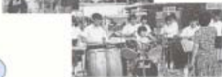
まほろば踊りを初披露