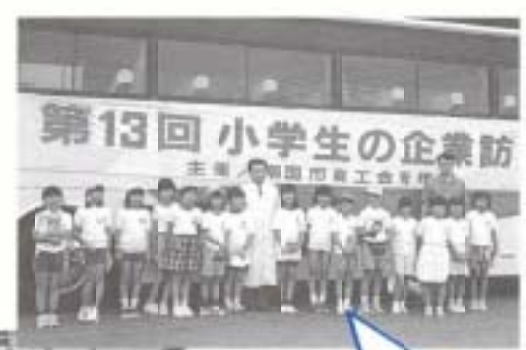
第13回 小学生の企業訪問