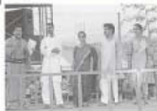
各国の民族衣装の ファッションショー