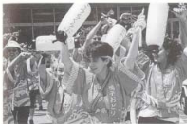
▲ 8/11 医科大学チームと高知クラブの2チームがよさこい鳴子踊りを披露してくれました (市役所)