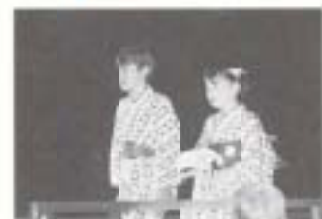
県美容環境衛生 同業組合による ゆかたショー