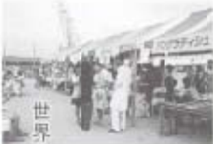
世界各国料理の出店