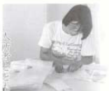
南国スーパー株式会社 (駅前町)

人斬り器を道具に作業に精を出す。コツコツと続けることが福祉の向上につながることを教わりました。