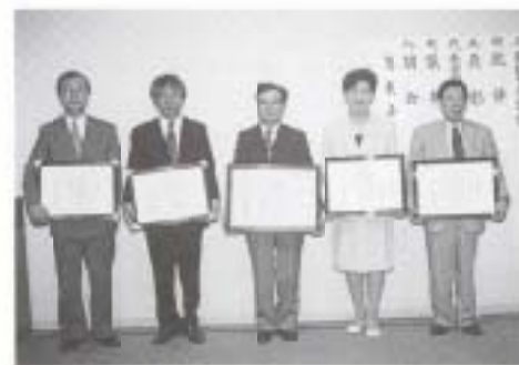
▲ 8/14 市献血推進会が厚生大臣表彰をまた個人・団体が知事表彰などを受賞 (ホリデイ・イン高知)