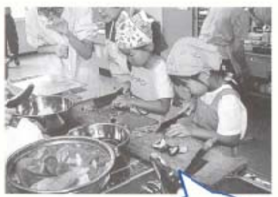
お母さんよりも 上手から?