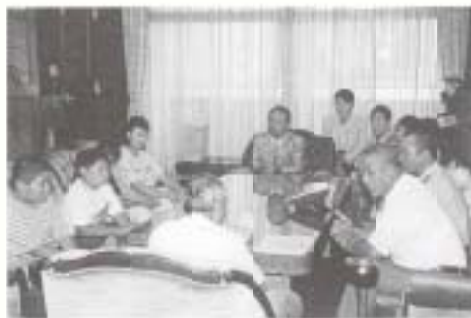
▶ 8/3~4 市連合婦人会が宿泊研修で交通安全などを学習 (市森林研究センター清純寮) ◀ 7/30 第10回警察少年柔道剣道全国大会出場報告 (市役所：和田道場門下生)