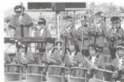
国府小のまほろば囃子で オープニング