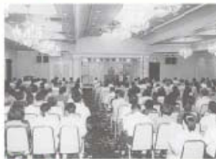
▲ 8/1 環境ホルモン講演会 (ホリデイ・イン高知)