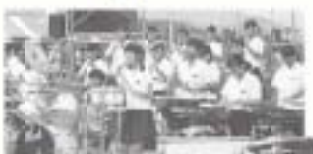
香長中音楽部に続いて 初参加の北陵中音楽部