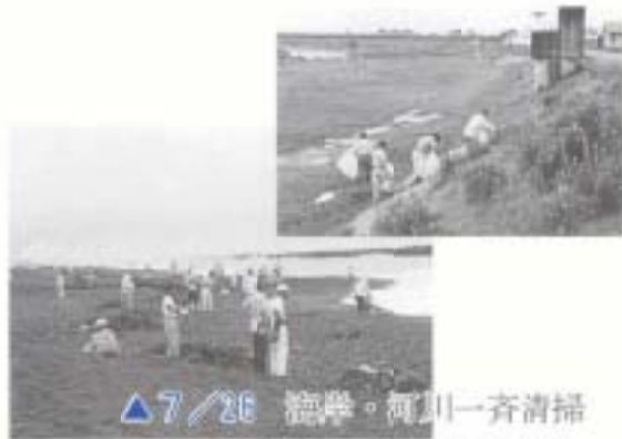
▲ 7/26 清掃・河川一斉清掃 (海岸、物部川沿い)