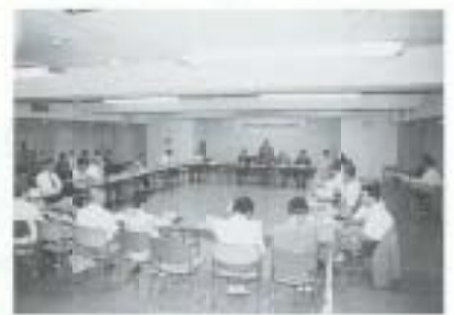
7/4 南国市交通安全市民会議 (市役所)