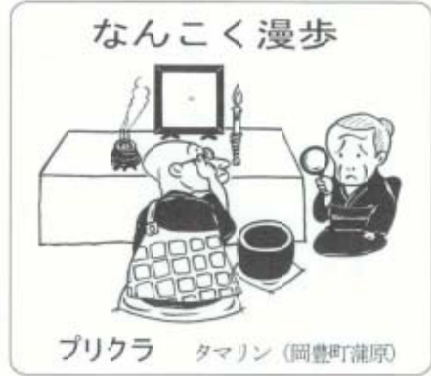
プリクラ タマリン (岡豊町蒲原)

氏名・学校名・学年・住所・電話番号を記入のうえ、申し込みください(はがき1枚につき1人、申し込み多数の場合は抽選となります)。