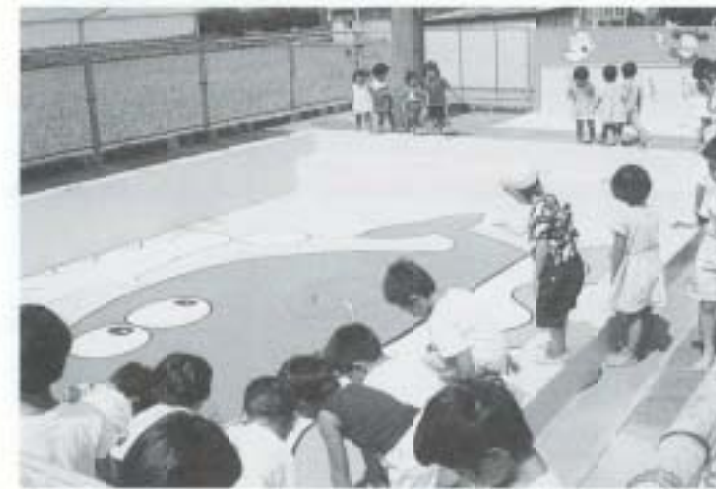
7/13 保護者がプールにタジラの絵を かいてくれました (後免野田保育所)