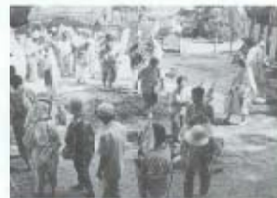
7/6 大護摩供養祈願祭 (十市:石土神社)