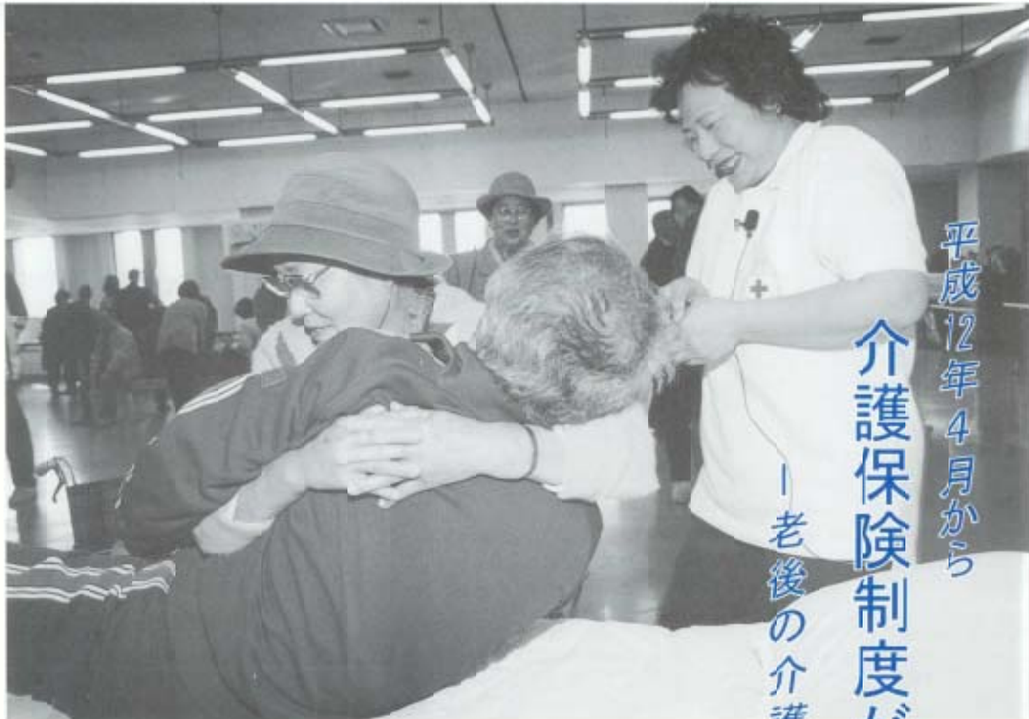
▲市長がモデルの介護実習 (なんこくボランティアデイ)

本格的な高齢社会が訪れようとしています。老後の最大の不安は、「寝たきりや痴呆になったときどうするか」という介護の問題です。たとえ介護が必要な状態になっても、できる限り自立し、誇り高く生を全うしたいと多くの人は考えています。老後に対するこうした不安を取り除き、少しでも安心して暮らしていただくために新しく生まれたのが「介護保険制度」です。この保険制度は、平成12年4月からスタートします。実施を目前に控え、介護保険の概要をお知らせします。