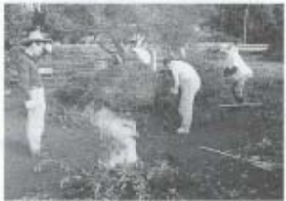
7/18 史跡の清掃 (比江庵寺跡)