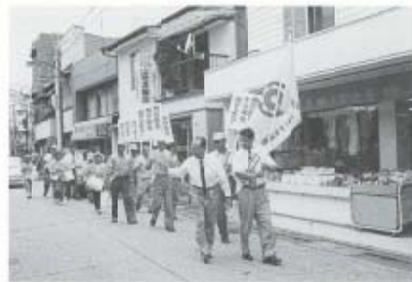
7/17 社会を明るくする運動 街頭パレード (後免町商店街)