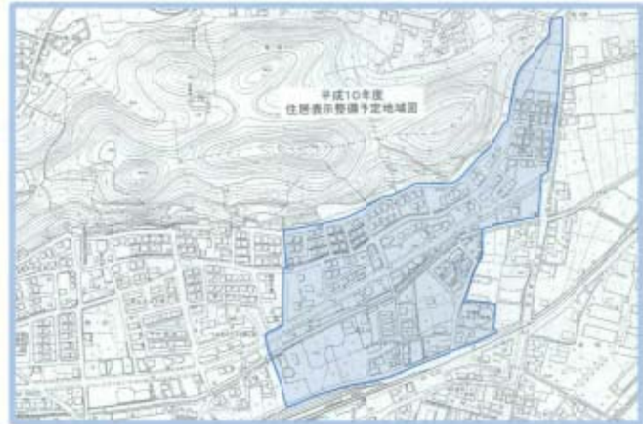
■町を新設する区域の名称

つきましては、本案について異議がある場合は、政令の定めるところにより、市長に対し、本件公告の日から30日を経過する日までに市議会議員および市長の選挙権を有する50人以上の連署をもって理由を附して本案に対する変更の請求をすることができます。以上、住居表示に関する法律第5条の2の規定により公告します。