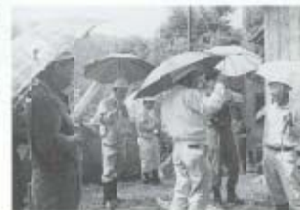
6/25 危険箇所パトロール (市内8カ所)