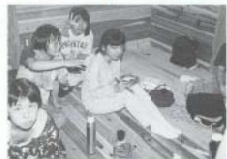
新しくなった「清純寮」の中で