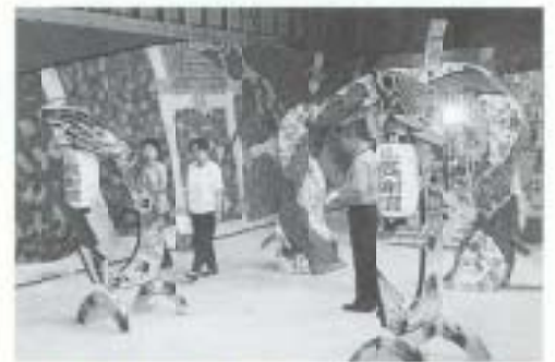
7/17~8/17 武内光仁さん(洋画家)野外個展 (白木谷)