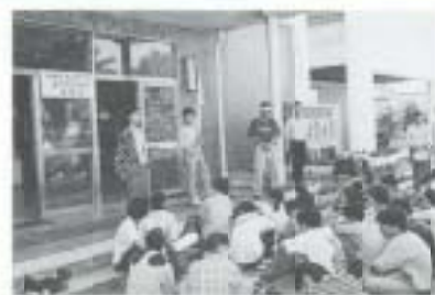
出発式で、気合いを入れて