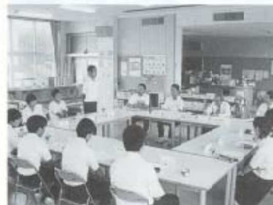
7/14 ドリームトーク開催 前年度に引き続き、市長と対談 (香長中学校)