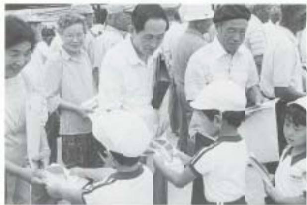
7/15 高齢者ドライバーに紅葉 マークを授与(土曜市広場)