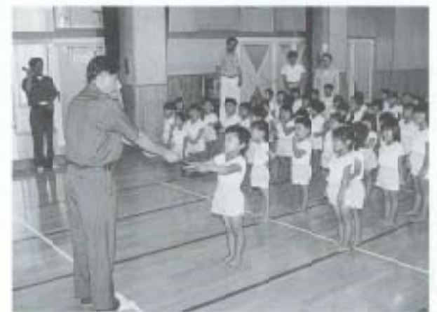
7/18 防火法被服呈式 (アトム幼稚園)