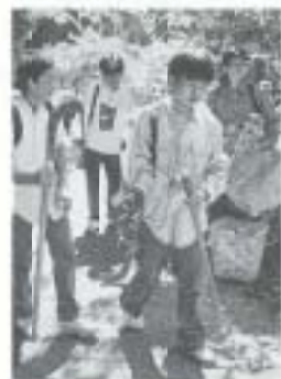
録を渡され、 2班に分かれて作業場へ