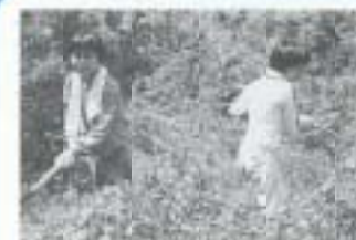
午後の作業 もうひとふんばり