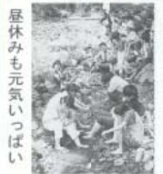
昼休みも元気いっぱい