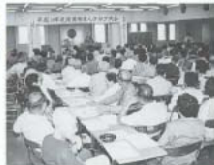
6/25 南国市老人クラブ大会 (社会福祉センター)