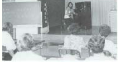
5/13 新しい講座です！ 『音楽を親しむ講座』 (大蔵公民館)