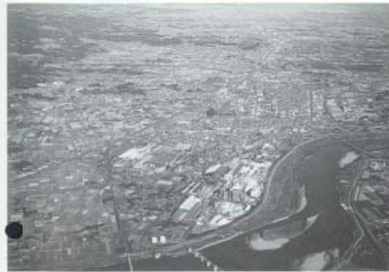
岩沼市の航空写真 写真手前には、阿武隈川が流れています

岩沼市は、仙台市の南約17kmに位置し、南部には阿武隈川が流れ、東は太平洋に面し、緑と水資源に恵まれた田園工業都市として発展してきました。産業では大昭和製紙岩沼工場、東洋ゴム岩沼工場があり、工業品出荷額は多く、仙台臨空工業団地の整備も行われています。農業も盛んで米作を中心にメロン・りんごなどの生産も行われています。観光面では、日本三種荷の一つである竹駒神社が有名で、年間180万人の参拝客が訪れています。今春には、花と緑のアミューズメントパーク「ハナトピア岩沼」がオープンし、多くの市民や観光客でにぎわっています。