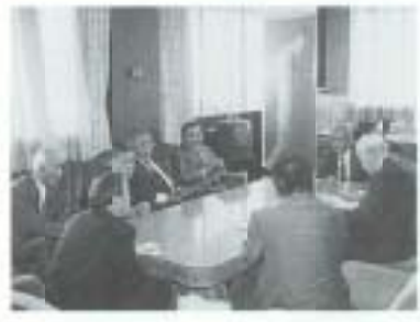
4/28 北海道県人会が表敬訪問 (市役所)