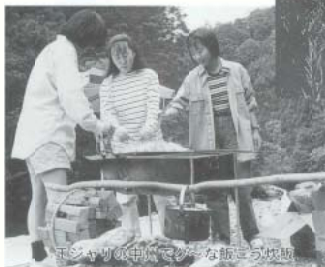
玉ジャリの中川でさ〜な飯ころ炊飯