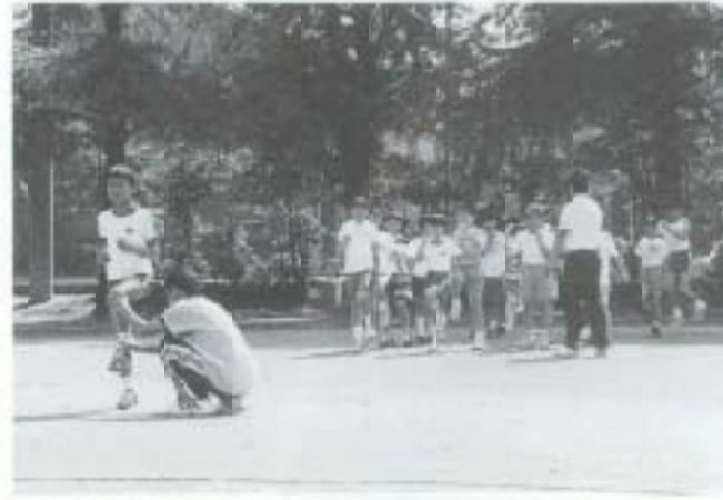
5/9 小学生陸上教室 (大蔵小学校運動場)