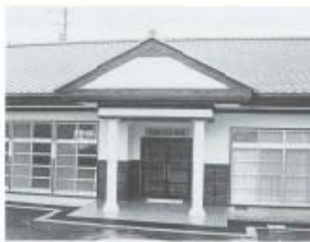
鉄筋コンクリート造 1階建て 152・37㎡