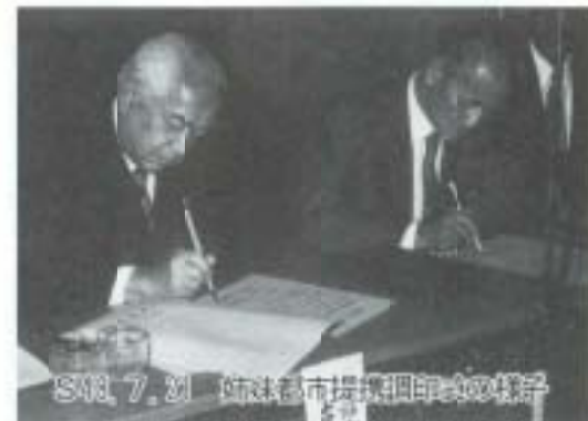
S48.7.21 姉妹都市提携25周年記念の様子