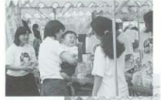
5/3と5 ウェルカム・サービス in南国 (道の駅南国)