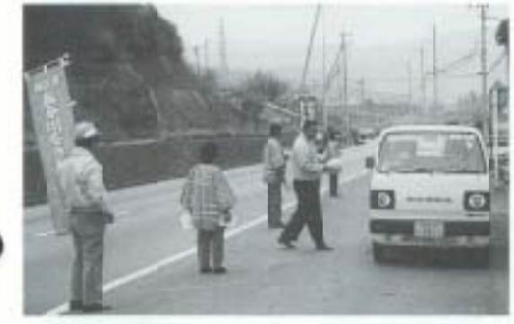
3/25 国分川をきれいにする会が、啓発チラシとタオルを配布 (国分川近辺)