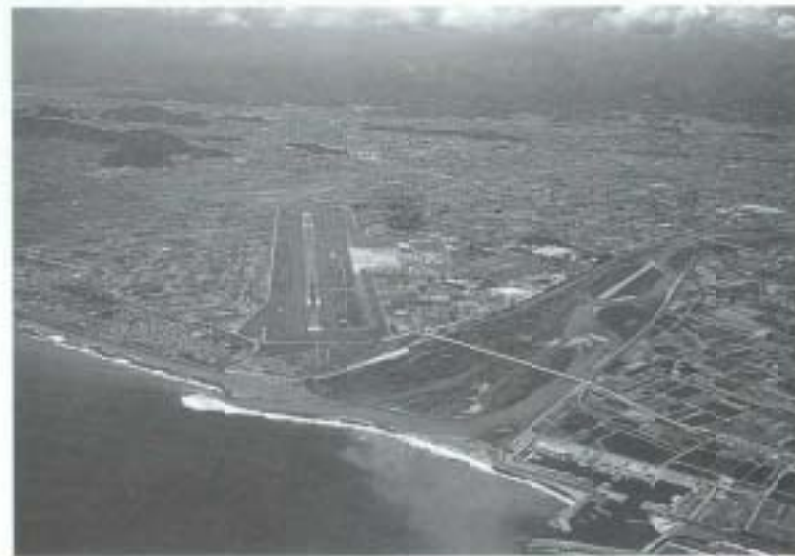
南国市の航空写真 高知空港と物部川のワンカット

る交流も活発で、お互いに両市の歴史・文化を学び合い、友好交流と相互理解を深めています。