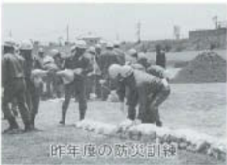
昨年度の防災訓練