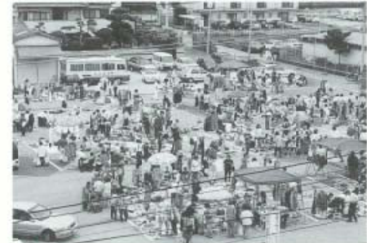
5/10 '98春WELCOMEなんこくフリーマーケット 今回も大にぎわい！ (市役所北駐車場)