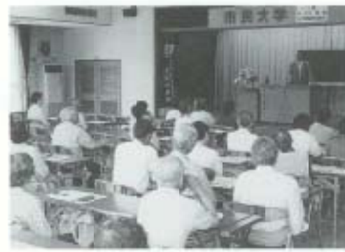
5/15 第18回市民大学 (大蔵公民館)