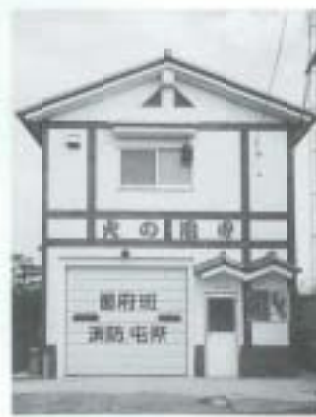
鉄筋コンクリート造 2階建て 32・39㎡