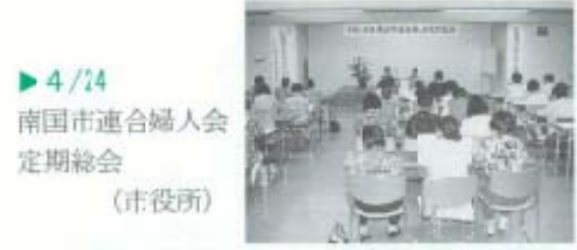
4/24 南国市連合婦人会定期総会 (市役所)