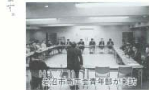
岩沼市物産青年部が来訪

る交流も活発で、お互いに両市の歴史・文化を学び合い、友好交流と相互理解を深めています。