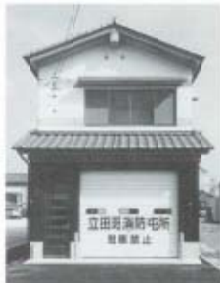
鉄筋コンクリート造 2階建て 79・54㎡