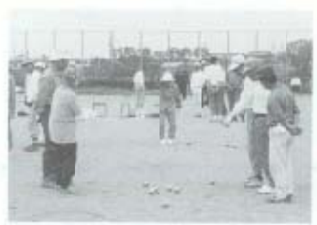
4/12 第1回議長杯 ペタテ大会 （高知空手道場の広場）