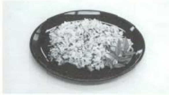
あっさり万人むき