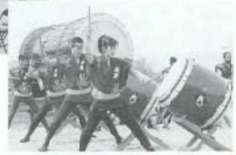
広見町の太鼓集団「魁」が 式典に華をそえました