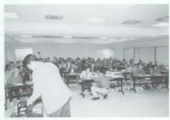
3/31 と高齢者にやさし い情報化社会へ向けて？ NHK高齢者視聴覚実験 （保健福祉センター）