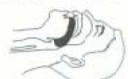
「舌根沈下」状態の人の気道

意識障害者にとっては、意識が消失し全身の筋肉が緩んでくるため（舌も筋肉）舌の根もとの部分が落ちこんで、気道をふさいでしまう。そのままにしておけば呼吸が停止してしまう。