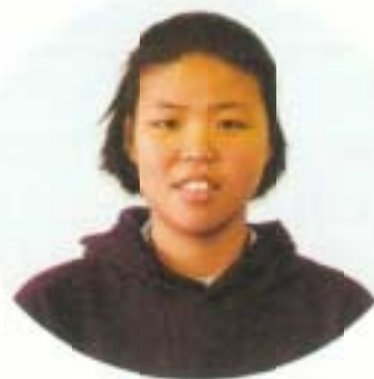
ネスリー ニクローターノン タイ王国