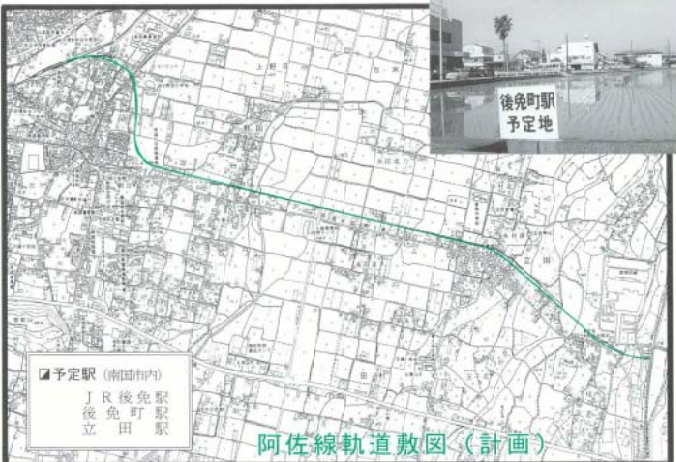
阿佐線軌道敷図（計画）