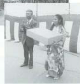
3/29 第4回貫之さくら祭り こしも打ち掛けをプレゼント （熊野神社）