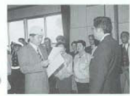
4/6 交通安全メッセージ伝達式 （南国警察署）