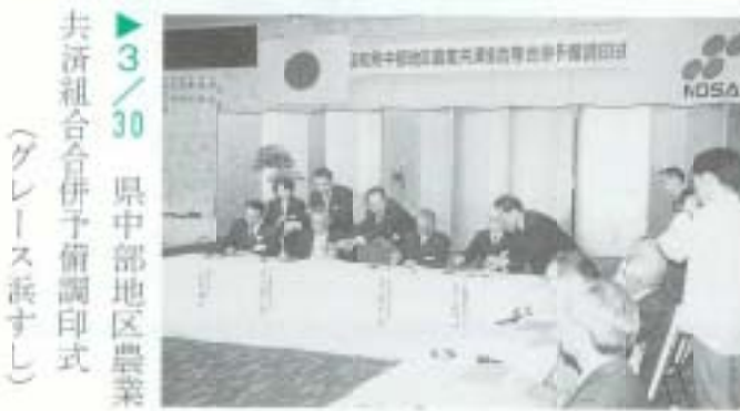
3/30 県中部地区農業 共済組合合併予備調印式 （グレース浜すし）