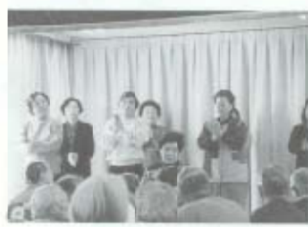
2/17 長岡地区婦人会 が清風園を訪問し、草津 節を披露（土佐清風園）