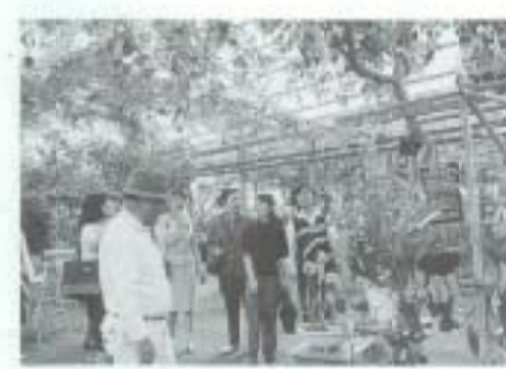
4/16 中華人民共和国婦人会 代表団が南国市を訪問 （西島園芸団地）