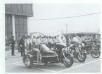
4/5 二輪愛好会が交通安全 週間前日に交通安全パレード （農協会館を出発）