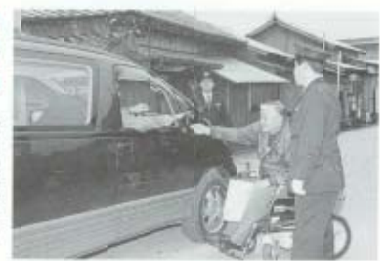
4/8 松山建城さん 交通安全を呼び掛け、恒 例のドライバーサービス （稲生郵便局前）