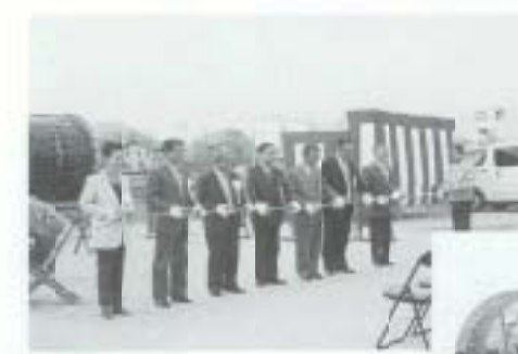
3/28 「南国市の土曜市 と愛媛県広見町の日曜市」 友好締結15周年式典 （土曜市広場）