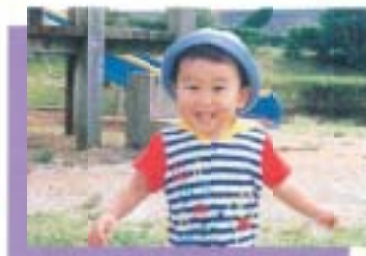
ちょっといぶりなボクだけど元氣百倍。今日は飛行機を別にきて大はしゃぎ♡ ボクもお空を飛びたいなあ...