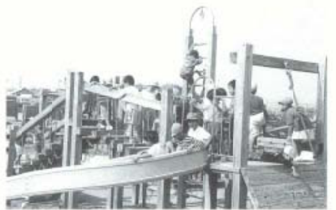
市営保育所運営の課題

これより先の平成七年「対話と理解」を基調にして設置された「保育所問題検討委員会」（市民各界各層の代表十五人）は、本年二月、保育所機能の充実と一部民営化、統廃合を骨子とする答申を行いました。