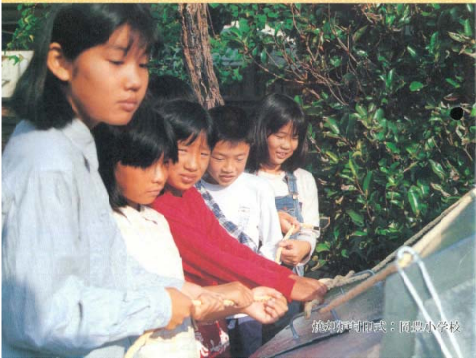
焼却炉封印式：岡豊小学校