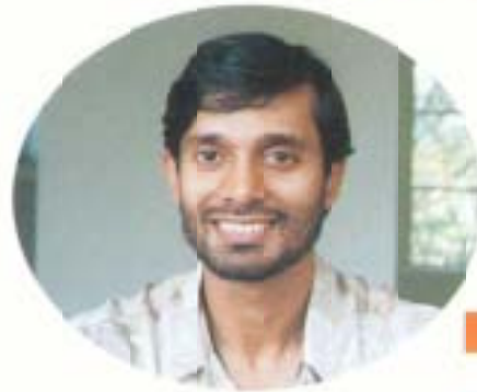
アルン・バイ・パテル (インド)