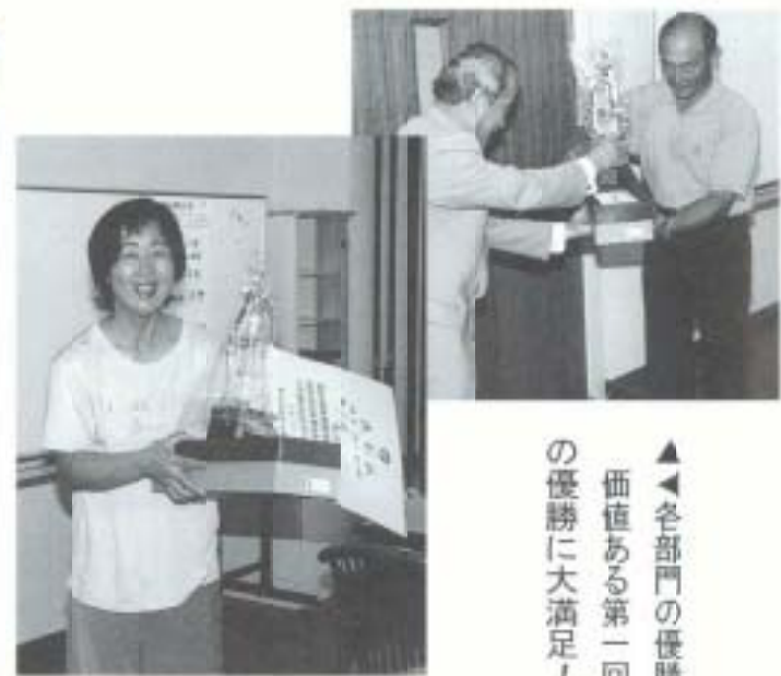
▲各部門の優勝者たち、 価値ある第一回目の大会で の優勝に大満足!