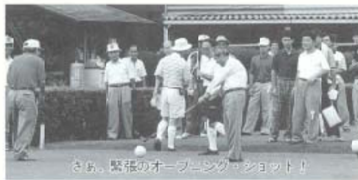
さあ、緊張のオープニング・ショット!