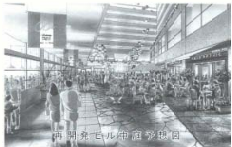
再開発ビル中庭予想図

総合体育館（前掲）建設の発注請負契約が今議会で提案されたことで、次に建設が予定される大型事業として図書館・文化会館が具体的に近づいてきました。二つの施設は市民がもつとも待ち望んでいる施設で、浜田市長も任期中にメドをつけるとの意志を表明し、行政改革の成果として実現するとしています。