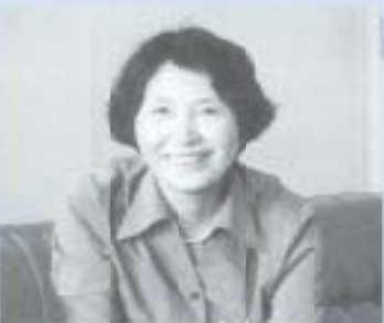
お気持二 お声をおかけください

「土佐の教育改革を考える会」の提案を受けて、学校・家庭・地域の連携により子どもたちの教育力を高めようと、県教育委員会がことしから行っている事業で全国でも初めての試みだからです。