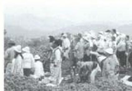
白髪山の自然を訪ねて

▲6月1日、市内で恒例の一斉清掃が行われました。朝早くから市内全域で溝掃除や空き缶拾いなどが行われ、子ども会活動の一環として参加する子どもたちの姿もあり、市民総出でのゴミ収集となりました。