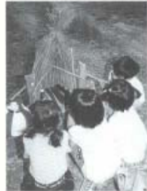
初夏の風物詩エンコウまつり

▲女性仲間での自然を楽しもうと、58人の参加者が6月1日、物部村の白髪山へ登りました。クマザサの広がる緩やかなスロープが続き、360度開ける大パノラマ。北に三嶺、西南が大きく迫り、東には剣山、次郎笠を望むことができ、一行は新緑したたる白髪山でさわやかな汗を流しました。