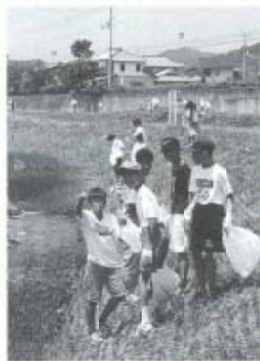
石土池で釣り糸などを回収

▼渡り鳥や水鳥の飛来する十市の石土池で六月七日、釣り人が捨てた釣り糸の被害から野鳥を守ろうと、十市小生校の全児童・教職員・保護者、初参加のアトム幼稚園児とその保護者ら合わせて約五百人が回収作業を行いました。参加者らはごみ袋を手に池の周辺を丹念に歩き、捨てた釣り糸のほか、空き缶などのゴミをトラック二台分収集しました。