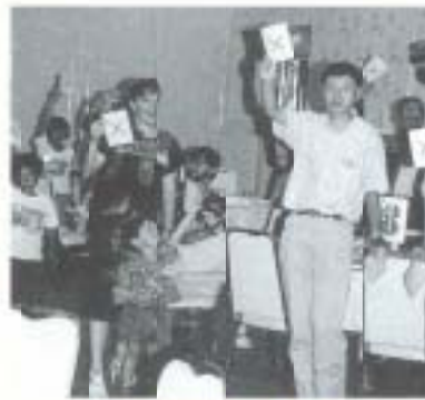
みんなで国際交流

オフィスパーク 四銀事務センターが落成 ▲オフィスパークへの立地第一号として進出を決め、昨年一月から建設工事が進められていた、四国銀行事務センターがこのほど完成し、六月十一日、関係者が出席して落成式典が催されました。新社屋の従業員規模は約二百五十人で、来年一月から稼働する予定です。