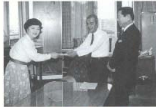
文化ホール建設に役立てて

女性防火クラブに新しい仲間が ▲婦人防火クラブの発足式が、五月三十一日、土曜市広場で行われました。今回「藤寿会(大塚)」「いちもんめユナイテッド(大塚)」の両婦人防火クラブが新たに発足し、南国市婦人防火クラブ連合会に加入、家庭から絶対火事を出さない、力強く決意の言葉を述べました。