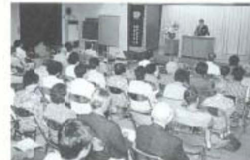
熱心に聞き入った市民大学

▲6月1日、前浜や久枝の長川筋一帯で、恒例のエンコウまつりが催されました。子どもたちはショウブの葉などで作った「ほこら」にエンコウが好物のキュウリやお酒を供え、ことしも水の事故がありませんようにと、手を合わせていました。