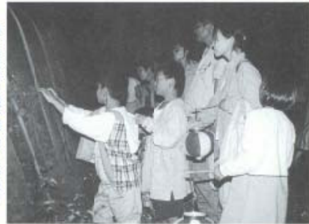
ほたるまつり親子連れでにぎわう

▶六月七日、才谷雄馬公園でほたるまつりが開かれ、親子連れら約四百人にぎわいました。参加者は宝探しやビンゴゲームを楽しんだ後、辺りがうす暗くなると、ほたるの観賞へとちやうらん行列、ほのかな光をはたしながら飛ぶほたるを堪能しました。