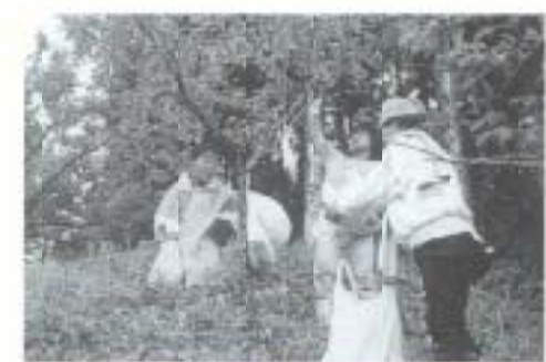
白木谷小児童が梅の実を収穫

▲6月2日、白木谷の「福祉の梅林園」で、同小学校の全校児童らが梅の実を収穫。児童らは、骨々とした実を民生委員さんと協力し合いながら取っていました。収穫した梅は、老人ホームなどに配られたり、梅ジュースにするそうです。