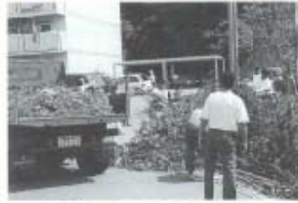
恒例行事です。市内一斉清掃

▲6月2日、文化の森を育てる会は、文化ホール建設に役立ててもらおうと、「第5回チャリティ舞踊会」でのパゾーの収益金10万円を市に寄贈しました。