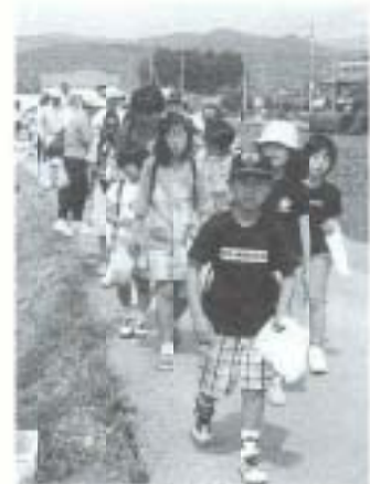
地元史跡を学ぶ、3世代歩こう会

▲学習することで新しい感動を発見し、相互の思いやりと生きがい求めてもらおうと、第十七回市民大学が大蔵公民館などを会場に五月十六日開講、最終日の六月十四日まで五講座が開かれました。各界から講師を招き、文化、高齢化社会、歴史、地質、人権問題について学習、それぞれの講師の熱心な参加者らはメモを取るなど聞き入っていました。