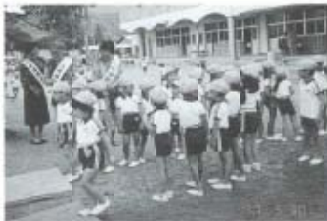
子どもの人権を守ろう！

▲子どもの人権を守ろうと、積極的に啓発活動を展開している人権擁護委員らが5月30日、ひまわり幼稚園(阿蘇町)を訪れ、同委員さんの話に園児たちが興味をもち、聞きめい耳を傾けていました。また、園児全員に夏船のプレゼントがありました。