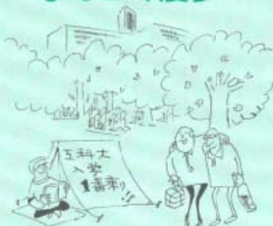
片地の春 ガンバレや... 岩本タケオ(金地)