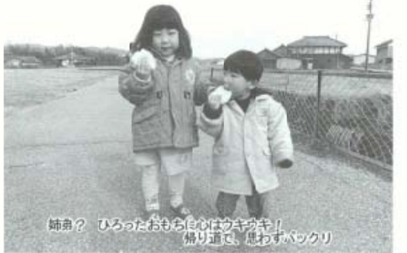
姉弟？ ひろったおもちに心はウキウキ！ 掃り道で、思わずバックリ

ヤンスは今日この時とばかり、カメラを肩や首にした写真家も多い。 老若男女入り乱れてのもち大争奪戦は、見ている側にはずいぶん長く感じた。 もち米を栽培した人、もちをついた人、投じた人、拾った人、皆さんお疲れさま、でも本当にすごい光景でした。