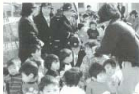
▲一月二十二日、後免野田保育所で、女性消防団員六人らによる、防火訓練が行われました。子どもたちは、消防ポンプ車に乗ったり、放水したりと、みんなが防火意識を高めました。