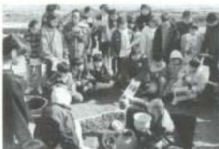
▲久礼田地区県営市場整備事業に伴い、昨年12月から「白猪田遺跡」を発掘調査している市教育委員会は、1月29日現地説明会を行いました。それによると十世紀ごろの掘っ立て柱建物跡E棟などの遺構のほか、土器を埋めた地鏡祭跡などが発見されています。この日は地域住民のほか、久礼田小学校の児童98人も参加、遠い昔に思いをはせ、説明を聞き入っていました。

▶2月3日、各種被害防止対策を広報し、もちつきや豆まきをとおして、交流を図ろうと、地域安全もちつき節分大会が行われました。南国地区地域安全協会の主催でことしが初めて、この日は、吾国保育園園児16人も参加し、鬼にふんした協会員に豆を投げて、楽しいひとときを過ごしました。