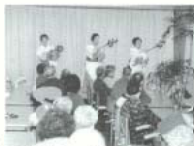
▲土佐清風園恒例の長寿者祝賀会が一月二十九日に開かれました。ことしは九十歳以上のお年寄り二十三人と米寿の五人がお年寄りはこの日を羨しみにしており、舞台上で西尾流新舞踊が披露されると大喜び、盛んな拍手が送られていました。

▶市教育委員会は、子どもたちに正しい走法を身につけてもらい、陸上競技力の向上を図ろうと、2月から毎月2回、第2・4の土曜日、小学生4・5年生を対象に陸上教室を開いています。第1回目の2月8日は、高知農高グラウンドに27人の参加で行われ、陸上競技協会のメンバーが指導に当たりました。