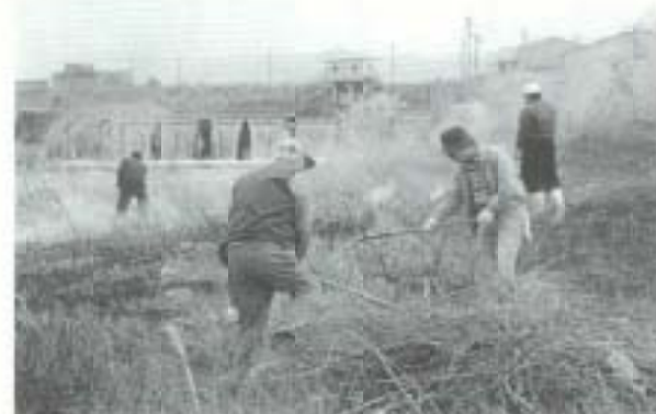
▲2月2日、恒例の国分川シヤ焼きが行われました。この日は、流域の4か所を集合同所に、市民・地元消防団員や四国電力職員など約700人が参加。清掃後には、七草がゆも振るまわれ、楽しい交流も行われました。

▶2月3日、各種被害防止対策を広報し、もちつきや豆まきをとおして、交流を図ろうと、地域安全もちつき節分大会が行われました。南国地区地域安全協会の主催でことしが初めて、この日は、吾国保育園園児16人も参加し、鬼にふんした協会員に豆を投げて、楽しいひとときを過ごしました。