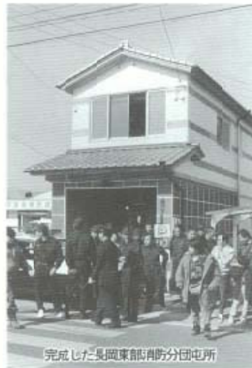
完成した長岡東部消防分団屯所

消防団員が活動する「火事場」などでは、チームワークと団結心が大変重要で、そういう意味では、目ごろから抜群に息の合う団員たち、話がもち上がるトントン拍子にまとまり「大きく祝おう」ということになりました。 農業を営む団員が多く、「もち米は自分たちで作ろう」ということで、昨年七月の種