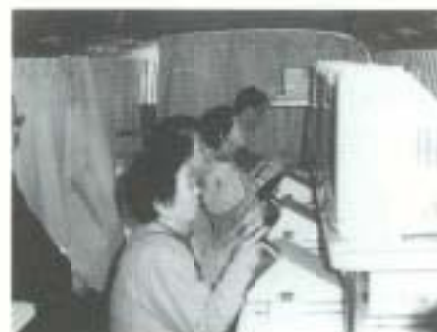
▲2月9日、第3回高齢者モデルクラブ研修会が、保健福祉センターで開催されました。南国長命会22人が運転適性、救急救命や夜間の交通安全について研修。特に、夜間の交通安全では、自転車などの反射材の効果に参加者全員が、身を持って体験しました。