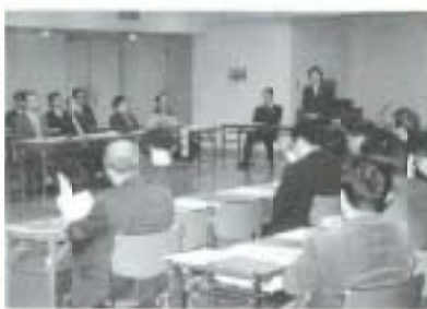
▲ことし発足十周年を迎えた久礼田地区史談会は、一月二十五日遺跡発掘に関する講演会と祝賀会を久礼田体育館で行いました。

▶2月4日、市長、教育長など市の教育関係者と学校長やPTA役員との教育懇談会が市大会議室で開かれ、これからの学校給食などについて議論が交わされました。