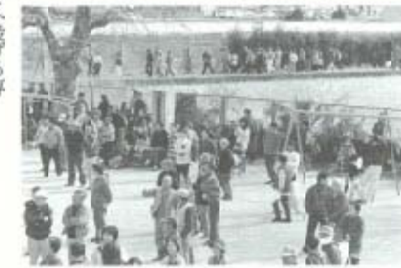
地元の長老が「これほどの人を見たことがない」と語った「人のなみ」が続くづく...

すっかり用意したおかあさんがいたりして、ちよつとした交流会場にもなって盛り沢山の「あらしの前の...」。