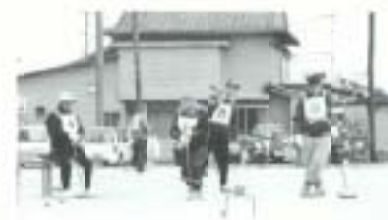
▲2月15日、第8回市長杯ゲートボール大会が開催されました。国保被保険者と市民の健康保持増進を目指し、25チーム140人が参加。元気にプレーしました。