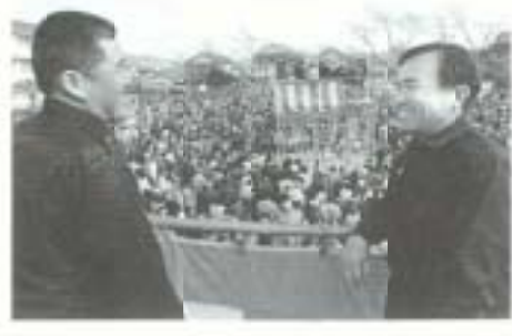
団員たちも、うれしそう

午後一時、一斉にもちまきが始まるとグラウンドに土けむりが立つほどでした。 一万三千個のもち投げは、十分ほどで終わりましたが、うまくもちが拾えた人、拾えなかった人、それぞれに楽しいイベントとなりました。