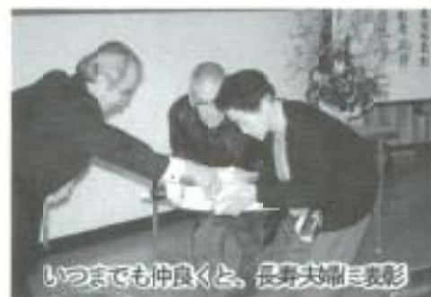
いつまでも仲良く、長寿夫婦表彰

長岡東部地区で、二月八日と九日、「健康づくり大会」(健康文化都市モデル地区事業実行委員会主催)が開催されました。