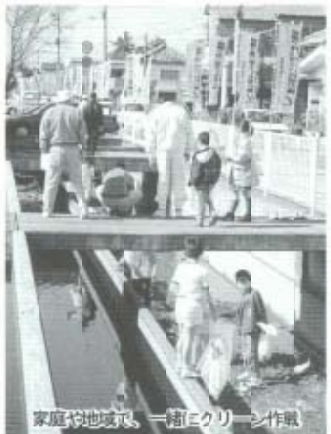
家庭や地域で、一緒にクリーン作戦