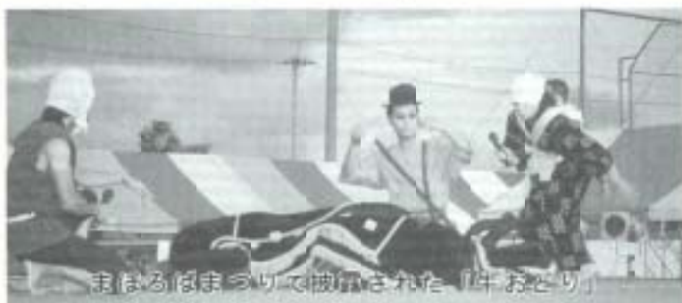
おどりはまわりのりて披露された「牛おどり」

◆牛のいる踊り（十市） 十市の牛おどりは、一九九六年、十市の青年を中心に復活した南国市の郷土芸能。農民が精糖工場、牛と力を合わせて働く様子が直伝されます。この中で歌われる「甘薯へかんしよ」校め歌は、「よさこい節」とならんで幕末土佐藩の民謡の「双壁」をなすものである、との記述があります。