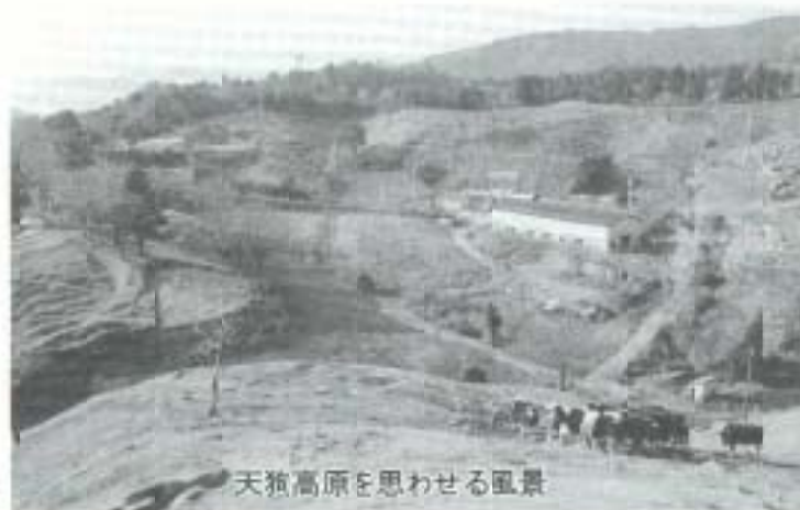
天狗高原を思わせる風景

◆牛のいる踊り（十市） 十市の牛おどりは、一九九六年、十市の青年を中心に復活した南国市の郷土芸能。農民が精糖工場、牛と力を合わせて働く様子が直伝されます。この中で歌われる「甘薯へかんしよ」校め歌は、「よさこい節」とならんで幕末土佐藩の民謡の「双壁」をなすものである、との記述があります。