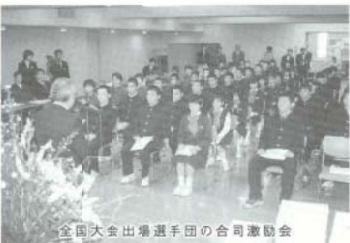
全国大会出場選手団の合同激励会

豊かな人間性など時代を越えて変わらない価値あるものを大切にすることも、社会変化に的確に、そして迅速に対応する教育が必要です。