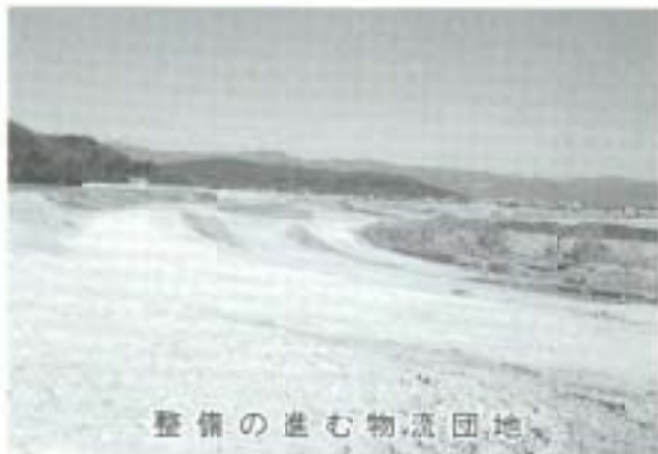
整備の進む物流団地

さらに、有型市総合計画基本構想に基づき、明るく潤いのある交通拠点都市を目指し、努力していきます。子どもやお年寄りにはやさしく、若者には魅力があり、実力が発揮できる都市づくりを目指し、基本計画の十大目標達成を全力で推進するため、財源対策・人材育成に力を注ぎたいと考えています。