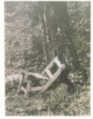
▲『老木と椅子』 井上 一夫