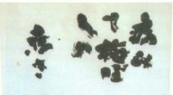
▲『病みて梅ぼしの赤さ』 藤田 正喜