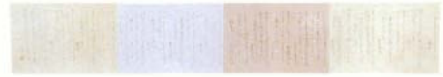
▲『鑑元永本古今集』 池知 松苑