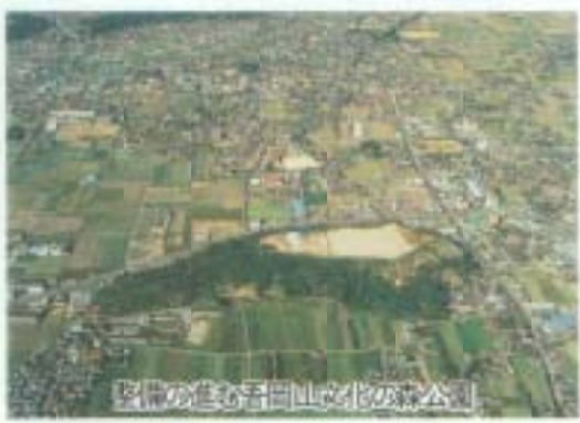
整備が進む吾岡山文化の森公園

業に着手しています。 学校給食に地場産米を導入することを目的に、農業委員会・農林課などが連携して、県給食会と再三の交渉を行ってきた結果、高知食糧事務所・県経済連・JA南国市・県教育委員会など関係機関との協議が整い、平成九年度から市内の中山間(上倉・瓶石)産の「米一黄金錦」を主に、供給するめどがつかまりました。 給食による米の消費拡大策としては、現在週三回の米飯給食制度を自炊炊飯方式により週五回実施とすべく、国・府・稲生小学校を実験モデル校に指定して準備を進めています。